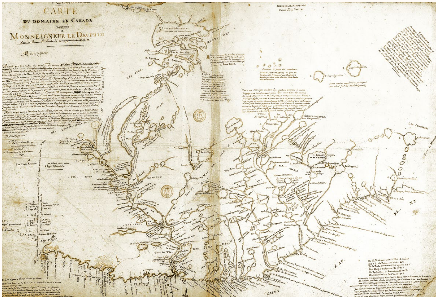
CARTE DU DOMAINE EN CANADA [...]. P.-M. Laure, 1731. Service historique de la marine, Vincennes. Recueil 67, n° 17.

Dès 1615, les récollets arrivent en Nouvelle-France. Les jésuites suivent dix ans plus tard. Ceci marque le début d'une présence religieuse qui ira croissante tout au long du XVII e siècle. En Nouvelle-France, l'Église est d'abord une église missionnaire. Très tôt, on tente d'organiser des missions. Au début, les résultats sont mitigés. Toutefois, même si l'initiative missionnaire éprouve des difficultés, elle permet aux autorités françaises de mieux connaître le territoire. En effet, comme les missionnaires n'hésitent pas à suivre les groupes autochtones vers l'intérieur des terres, ils en rapportent quantité d'informations sur le pays et ses ressources. Consignées dans leurs relations de voyages, elles seront très utiles aux cartographes, qui les utiliseront pour représenter le territoire. Les Relations des jésuites furent très utiles à cet égard, et les Delisle les utiliseront abondamment dans leurs travaux. Leurs cartes en témoignent. Publiées au début du XVIII e siècle, elles donnent une image de plus en plus précise de la Nouvelle-France.