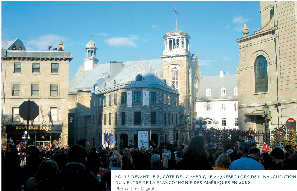
FOULE DEVANT LE 2, CÔTE DE LA FABRIQUE À QUÉBEC LORS DE L'INAUGURATION DU CENTRE DE LA FRANCOPHONIE DES AMÉRIQUES EN 2008

anglophone) qui les invite à se repositionner sur l'échiquier culturel et politique des Amériques.