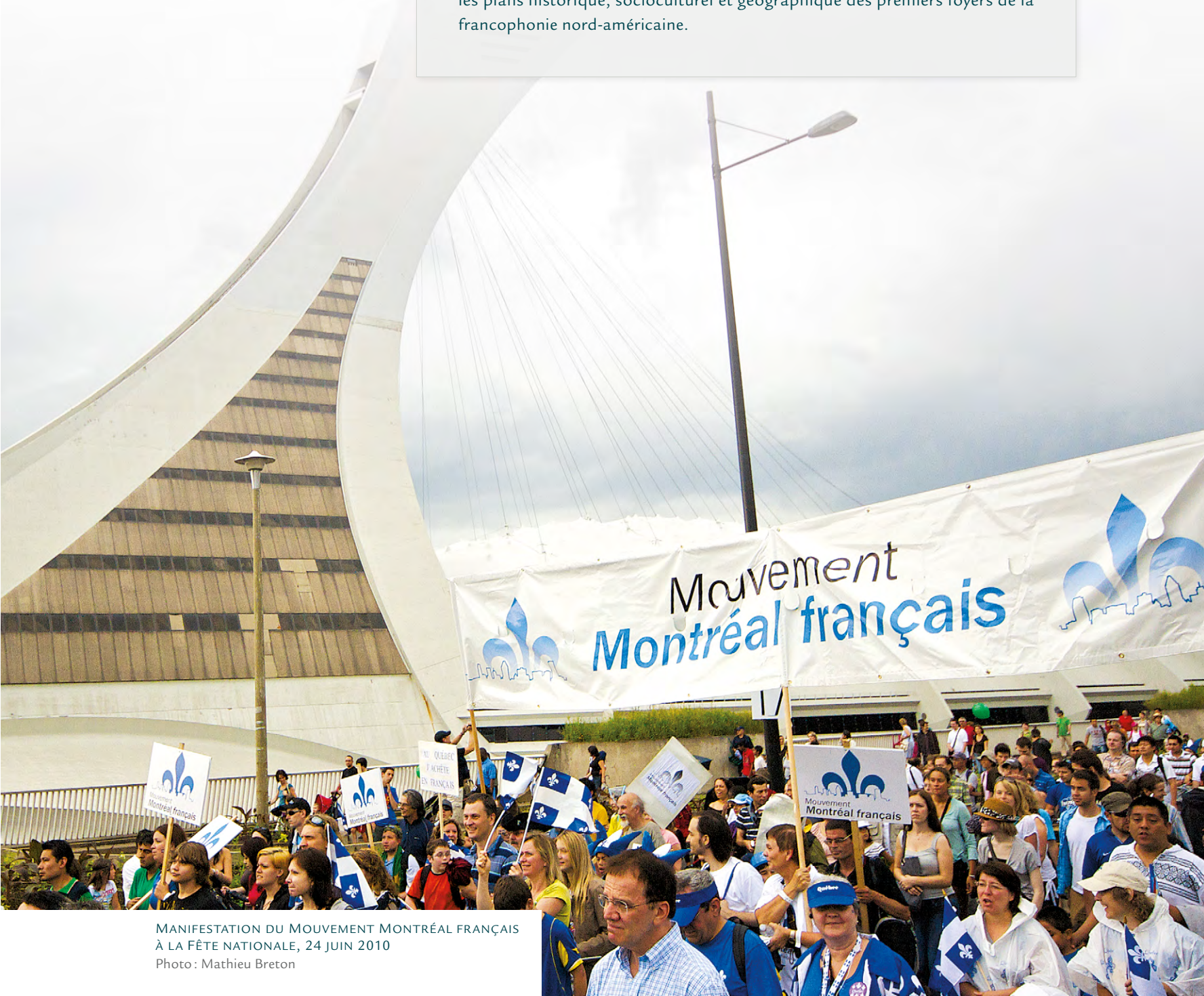
MANIFESTATION DU MOUVEMENT MONTRÉAL FRANÇAIS À LA FÊTE NATIONALE, 24 JUIN 2010

..... Ces questions et ces développements récents mettent en évidence le fait que de grands pans de l'histoire et de la géographie de la francophonie nord-américaine restent encore à explorer. Si les chercheurs sont ainsi conviés à adopter une lecture moins centrée sur l'expérience canadienne-française, il ne faut pas pour autant négliger l'influence fondamentale sur les plans historique, socioculturel et géographique des premiers foyers de la francophonie nord-américaine.