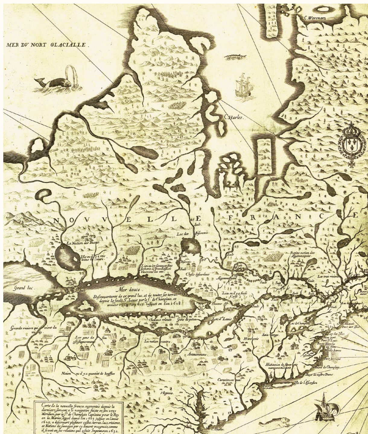
CARTE DE LA NOUVELLE FRANCE [...], Samuel de Champlain, 1632. Archives nationales du Canada. NMC 51970.