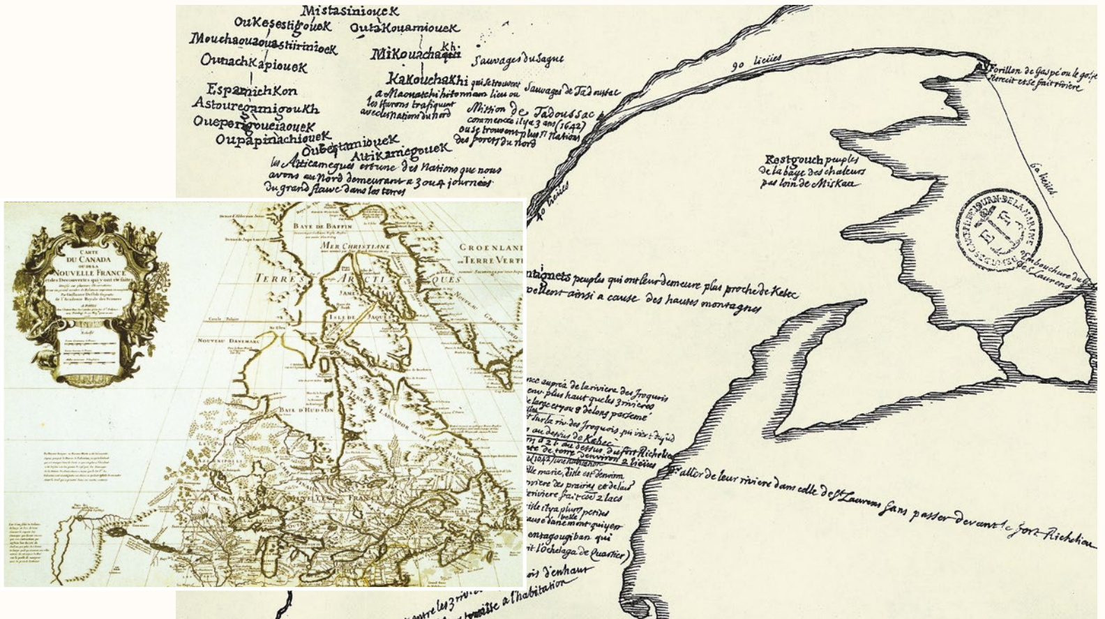
CARTE DU CANADA OU DE LA NOUVELLE FRANCE [...]. Guillaume Delisle, 1703. Archives nationales du Québec, Québec. P1000, S5, Amérique du Nord, 1703.