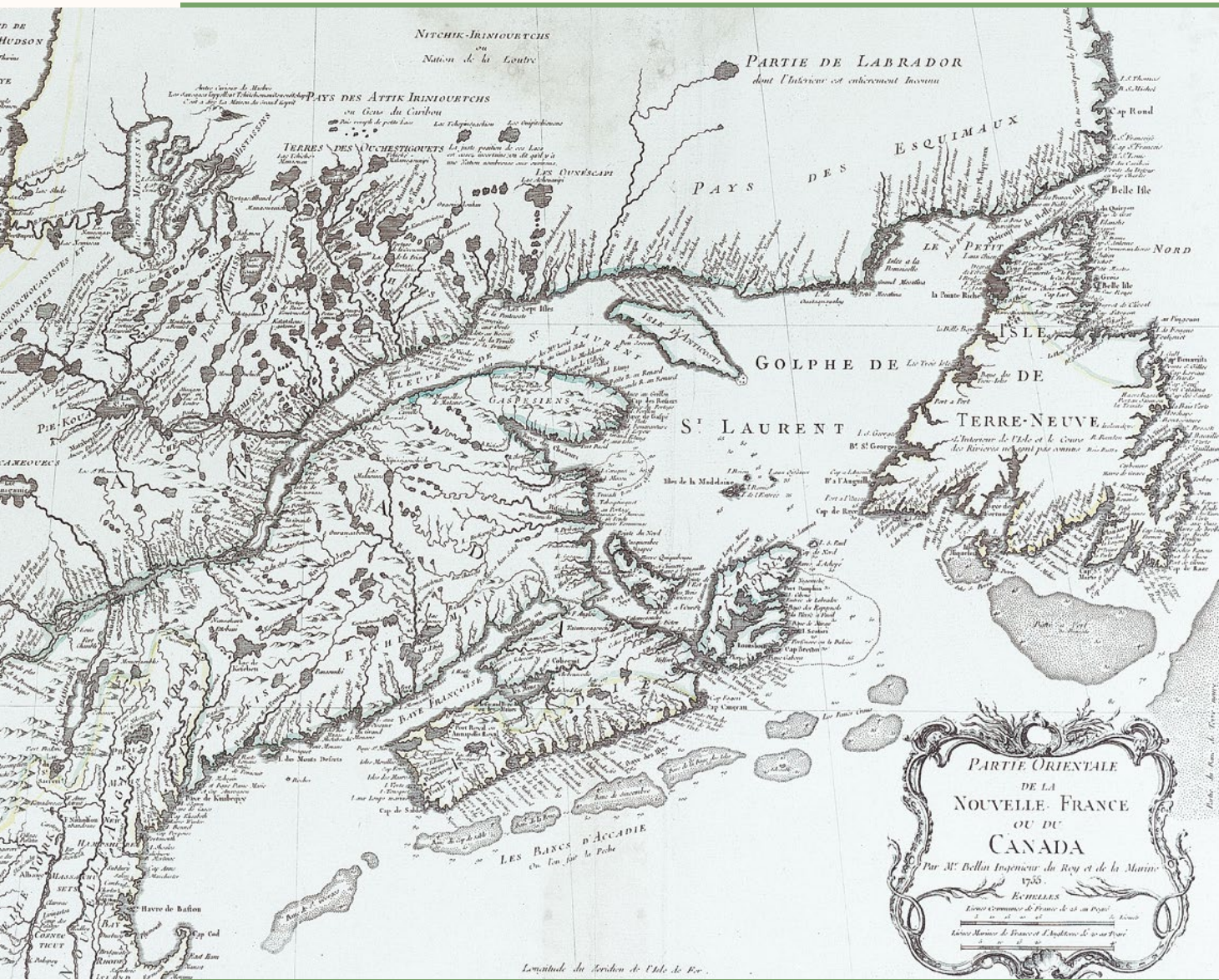
PARTIE ORIENTALE DE LA NOUVELLE-FRANCE OU DU CANADA [...]. Nicolas Bellin, 1755. Archives nationales du Québec, Québec. P1000, S5, Amérique du Nord, 1755.

La fréquence des conflits entre les Anglais et les Français en Amérique a beaucoup influencé la production cartographique des XVII e et XVIII e siècles. Dès le début du XVII e siècle, les deux puissances rivalisent pour le contrôle des ressources et du territoire. Très tôt, on s'affronte sur la côte est et dans la baie de Fundy. De là, le conflit s'étend à la région du Richelieu et du lac Champlain. Ajoutés à la quantité d'écrits et de cartes provenant de la Nouvelle-France, ces litiges contribuent à la création de lieux de centralisation de l'information. Déjà, l'Académie royale des sciences avait joué ce rôle auprès des scientifiques. Mais, le contexte changeant, l'État souhaite un meilleur contrôle et une meilleure diffusion de l'information en provenance des colonies. Aussi crée-t-il, dès 1720, le Dépôt des cartes, plans et journaux de la Marine, où seront rassemblés désormais la plupart des documents cartographiques produits dans l'Empire.