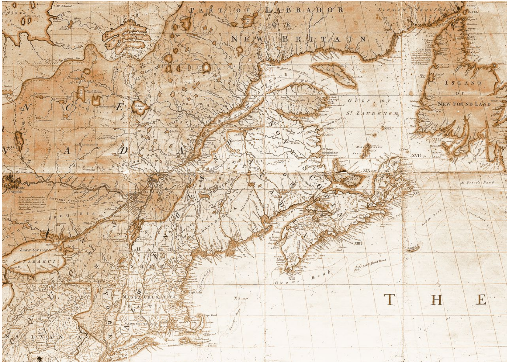
A MAP OF THE BRITISH AND FRENCH DOMINION IN NORTH AMERICA [...] (EXTRAIT). John Mitchell, 1755.

Une des principales conséquences de cette centralisation de l'information est donc d'améliorer les représentations du territoire. Une autre est de mieux utiliser cette information, pour n'en laisser paraître que les aspects les plus avantageux afin d'en faire la base des prétentions coloniales. Ainsi, en comparant la carte de Bellin de 1755 avec celle de John Mitchell parue la même année, on constate que si Bellin dispose de meilleures sources pour la cartographie de la partie française du territoire, en revanche Mitchell domine la représentation des colonies anglaises. Néanmoins, les deux représentations se valent puisqu'elles défendent les intérêts respectifs de leur nation. Le tracé du territoire de la Compagnie de la baie d'Hudson en offre une illustration. Tandis que sur la carte de Bellin ce territoire se limite à une mince bande de terre autour de la baie, sur celle de Mitchell il s'étend loin vers l'intérieur des terres, incluant même les lacs Abitibi et Mistassini. De même, contrairement à Bellin qui arrête la frontière nord de la Nouvelle-Angleterre à la rivière Kennebec, Mitchell la reporte à la rivière Sainte-Croix. Même la toponymie est différente et traduit des prétentions opposées : la baie de « Fundy » sur la carte de Mitchell est appelée « Françoise » sur celle de Bellin.