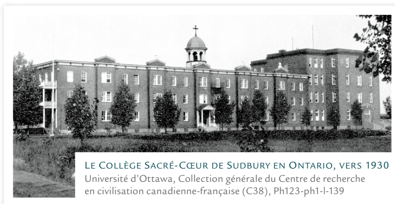
LE COLLÈGE SACRÉ-CŒUR DE SUDBURY EN ONTARIO, VERS 1930

À GAUCHE Fondé en 1913 par les jésuites, le Collège Sacré-Cœur deviendra rapidement un lieu éducatif central pour les Canadiens français du Nord de l'Ontario.