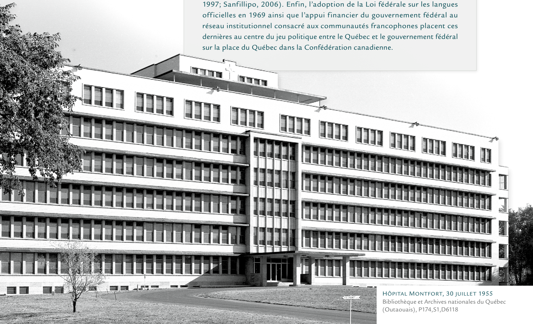
HÔPITAL MONTFORT, 30 JUILLET 1955

La Révolution tranquille et l'intervention de l'État québécois dans les relations entre le Québec et les groupes francophones en Amérique du Nord, puis la tenue du concile Vatican II et le recentrage du clergé sur les activités pastorales, amènent les communautés francophones à se repositionner (Martel, 1997; Sanfillipo, 2006). Enfin, l'adoption de la Loi fédérale sur les langues officielles en 1969 ainsi que l'appui financier du gouvernement fédéral au réseau institutionnel consacré aux communautés francophones placent ces dernières au centre du jeu politique entre le Québec et le gouvernement fédéral sur la place du Québec dans la Confédération canadienne.