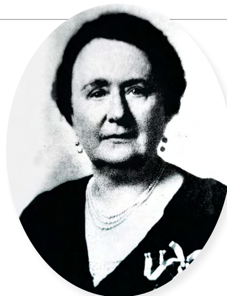
▲ ALMANDA WALKER-MARCHAND, VERS 1928 Université d'Ottawa, Centre de recherche en civilisation canadienne-française, fonds Fédération nationale des femmes canadiennes-françaises (C53), Ph52-40

CI-DESSOUS Présidente-fondatrice de la Fédération des femmes canadiennes-françaises (FFCF), Almada Walker-Marchand en dirige les destinées jusqu'en 1946.