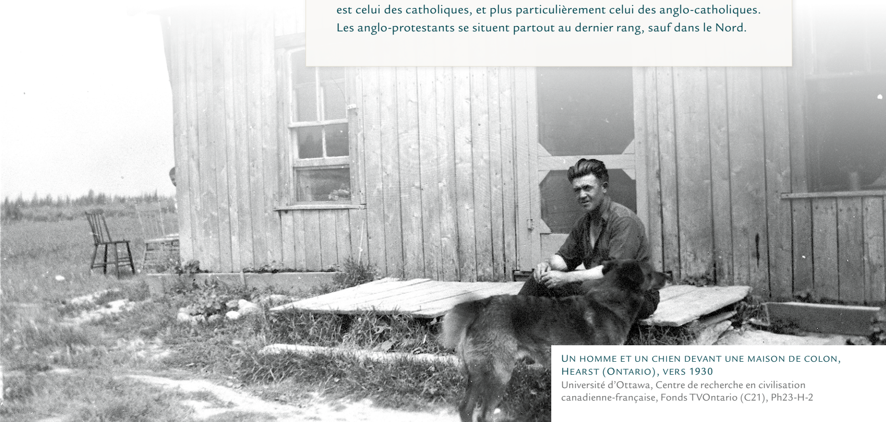
UN HOMME ET UN CHIEN DEVANT UNE MAISON DE COLON, HEARST (ONTARIO), VERS 1930

..... En parcourant les écrits des historiens et des sociologues, on ne peut qu'être incité à penser que les catholiques auraient été partout et en tous lieux les plus résistants à l'appel de la ville. Mais tel n'est pas le cas en 1941. En effet, dans la majorité des régions de la province, le taux d'urbanisation le plus élevé est celui des catholiques, et plus particulièrement celui des anglo-catholiques. Les anglo-protestants se situent partout au dernier rang, sauf dans le Nord.