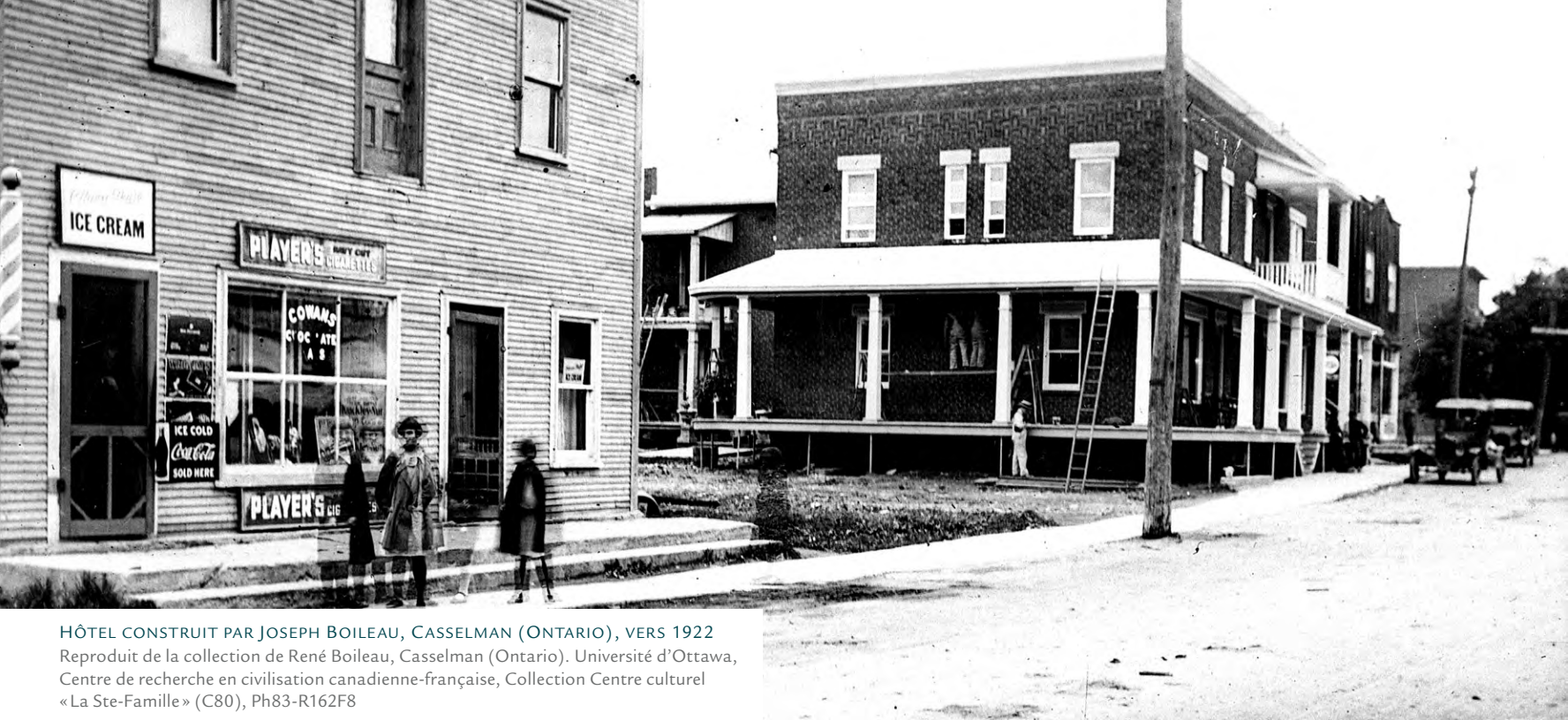
HÔTEL CONSTRUIT PAR JOSEPH BOILEAU, CASSELMAN (ONTARIO), VERS 1922