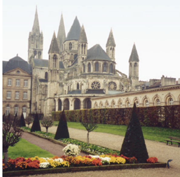
ABBAYE AUX HOMMES, CAEN, XII e SIÈCLE.

prétexte de quelque privilège que ce soit, de présenter quelqu'un de quelque manière que ce soit, pour les bénéfices de son droit de patronage, si ce n'est à l'évêque ordinaire du lieu auquel appartient de droit, tout privilège cessant, la provision ou l'institution de ce bénéficiaire. Autrement la présentation et l'institution qui pourraient suivre seraient nulles et tenues pour telles. » En somme, la cure devenait désormais pourvue au concours. La vacance était affichée et les candidats se présentaient devant un jury de trois docteurs pour y être examinés.