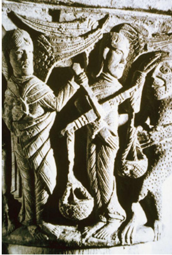
LA PESÉE DES ÂMES, SAUJON.