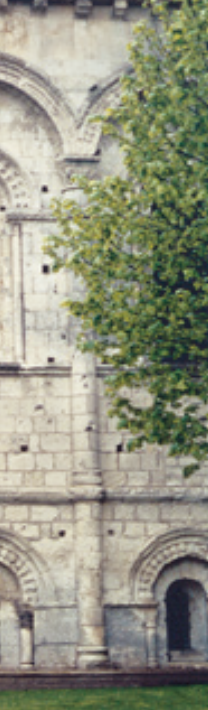
SAINT-EUTROPE, SAINTES.