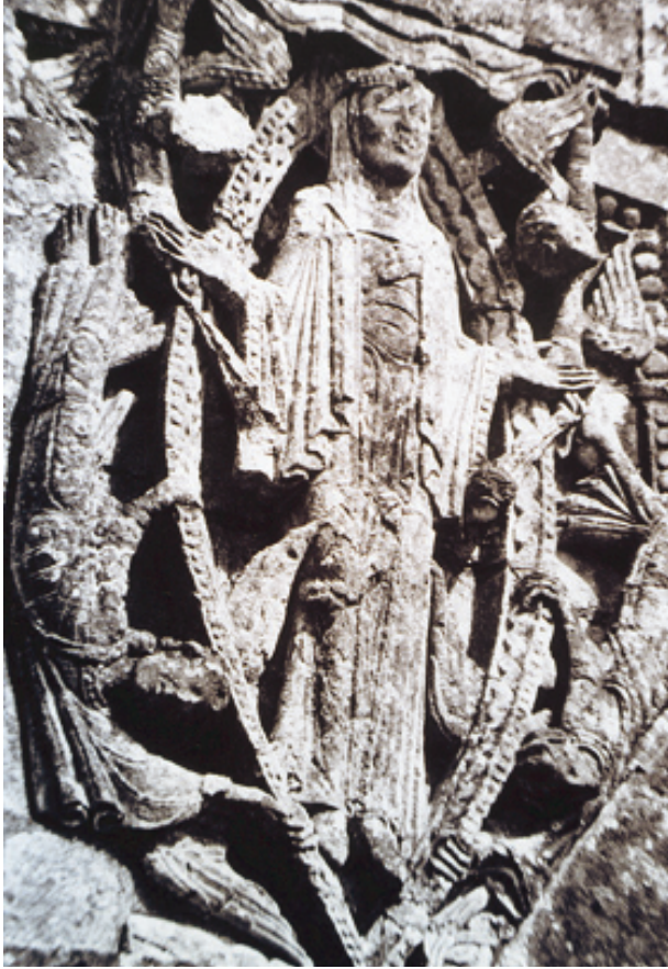
VIERGE EN GLOIRE, GENSAC LA PALLUE.