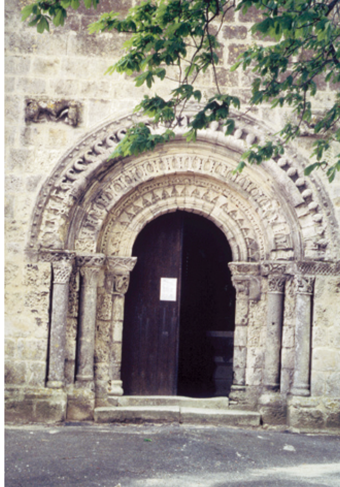
SAINT-SULPICE D'ARROULD. Photographie Philippe Laugrand.

ABBAYE, TRIZAY. Photographie Philippe Laugrand.