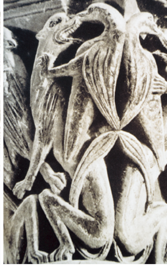
AIGLE ET LIONS, ARCES.

Elles constituent plutôt un relais, dans les petits centres, de l'église épiscopale. C'est l'évêque qui préside aux baptêmes, à la réconciliation des pénitents et aux célébrations des grandes fêtes. Les offrandes sont toujours centralisées par l'Église du « diocèse ».