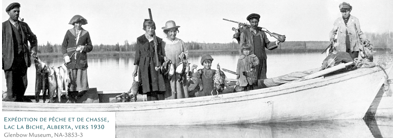
EXPÉDITION DE PÊCHE ET DE CHASSE, LAC LA BICHE, ALBERTA, VERS 1930

Le recensement canadien de 1941 sera pendant longtemps le dernier à dénombrer les Métis, un témoignage éloquent de leur marginalité sociale, économique et politique depuis 1885, année de leur défaite militaire à Batoche et de la pendaison de Louis Riel, leur chef politique. Cette marginalité s'exprime spatialement. Ils sont moins nombreux dans leurs anciens fiefs que sont, au XIX e siècle, les régions de Winnipeg, de Batoche (au nord de Saskatoon) et la zone de prairies. La majorité est maintenant cantonnée dans le nord et l'ouest, ou en bordure de la frange boréale, y vivant surtout de chasse, de pêche et de trappe. Ils résident parfois directement sur la réserve routière (on les appelle les Road allowance people ) ou à proximité de réserves indiennes, dans des habitations de fortune. C'est dans le but d'améliorer leurs conditions d'existence que le gouvernement de l'Alberta crée, dans les années 1930, douze « réserves » métisses ( Métis settlements ), toutes situées dans la partie septentrionale de la province.