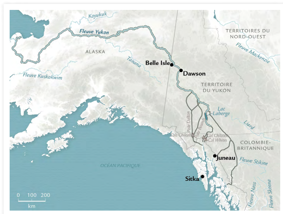
PRINCIPALES ROUTES VERS LE YUKON, VERS 1898

ON DOIT LE TERME « FRANCOPHONE DU POURTOUR » À GRATIEN ALLAIRE. POUR CET HISTORIEN, LES FRANCOPHONES DE LA COLOMBIE-BRITANNIQUE, DU YUKON, DES TERRITOIRES DU NORD-OUEST, DU NUNAVUT ET DE TERRE-NEUVE-ET-LABRADOR SE DISTINGUENT PAR LE CARACTÈRE PÉRIPHÉRIQUE DE LEURS COMMUNAUTÉS (ALLAIRE, 1999).