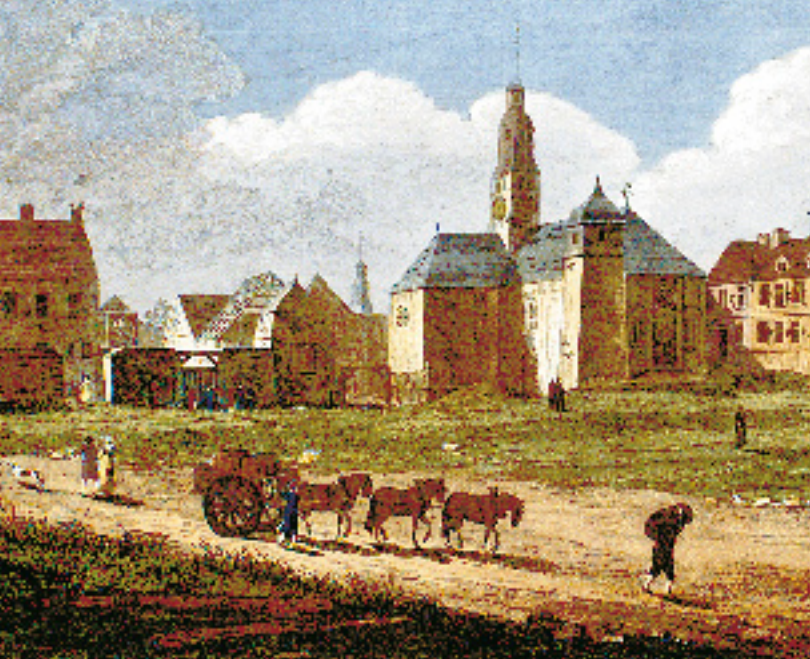
VUE DE L'ÉGLISE ET DU COLLÈGE DES JÉSUITES (DÉTAIL).

Archives nationales du Canada, C. Grignon, d'après R. Short, C-000354.