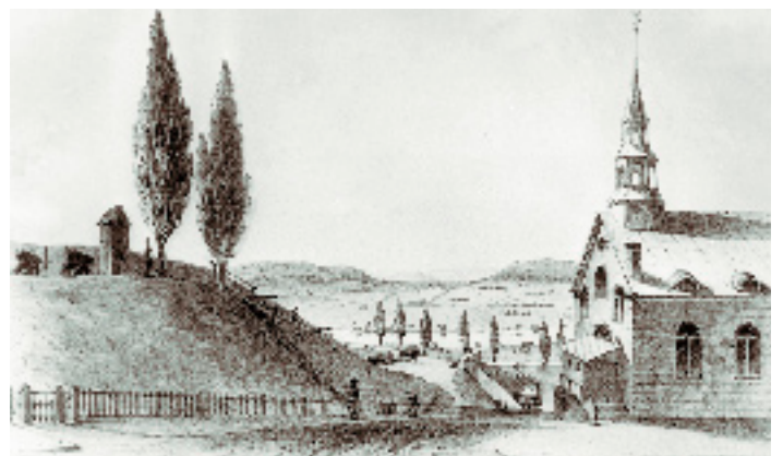
VIEW FROM ESPLANADE, QUÉBEC. Archives de la Ville de Québec, Sarony and Major, négatif n° 10650.

Ainsi, le legs impérial britannique se met rapidement en place, même si la population britannique est encore largement minoritaire. La nouvelle domination se fait sentir sur les tous les plans de la vie politique, économique et sociale. L'élite britannique adapte le milieu urbain à ses besoins. D'ailleurs, vers la fin du siècle, la qualité de vie dans ses quartiers tranche sur celle des quartiers populaires et canadiens.