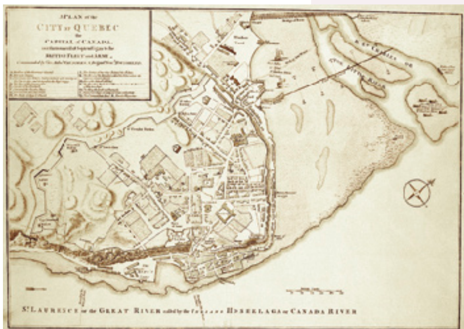
A PLAN OF THE CITY OF QUEBEC, THE CAPITAL OF CANADA [...], 1759. Archives nationales du Québec, T. Jefferys, P1000, S5, B-942-Québec-1759.