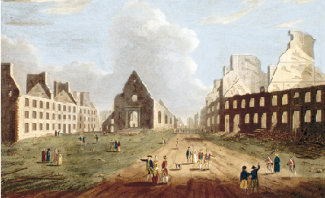
VUE DE L'ÉGLISE DE NOTRE-DAME-DE-LA-VICTOIRE ; BÂTIE EN MÉMOIRE DE LA LEVÉE DU SIÈGE EN 1695 ET DÉMOLIE EN 1759.

A. Bennoist, d'après R. Short, C-000357.