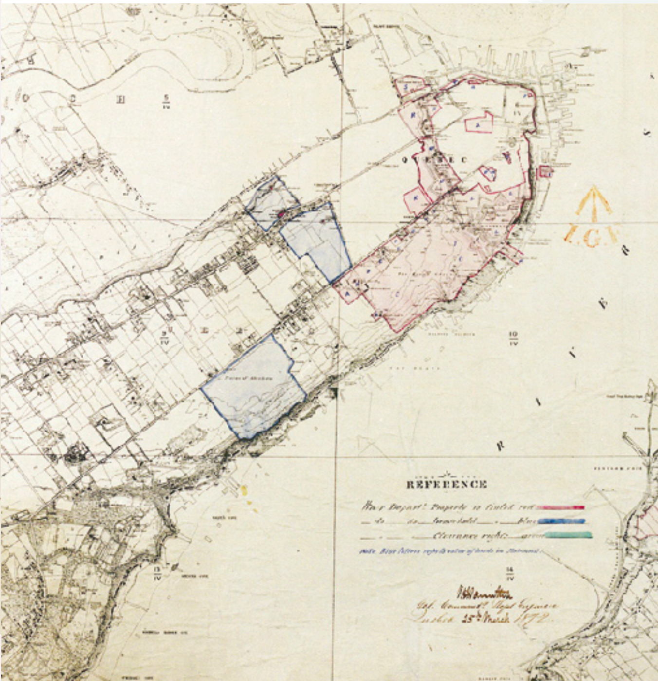
FORTIFICATION SURVEYS. PLAN OF THE ENVIRONS OF QUÉBEC, SURVEYED BETWEEN 1864-7 (DÉTAIL).

C'est après 1796 et jusqu'au milieu du XIX e siècle que les militaires vont étendre considérablement leur domaine en achetant, en expropriant (avec dédommagements) ou en louant plusieurs lots sur la colline de Québec, dans le but de maintenir les glacis de la Citadelle et de l'enceinte ouest libres de construction et de freiner l'expansion du faubourg Saint-Jean.