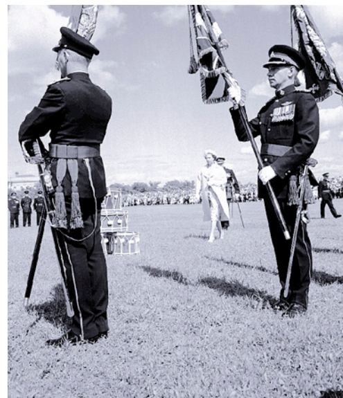
LA REINE ÉLIZABETH II À QUÉBEC, 1959.

Archives nationales du Québec, Neuville Bazin, E6, S7, P2721-59-H.