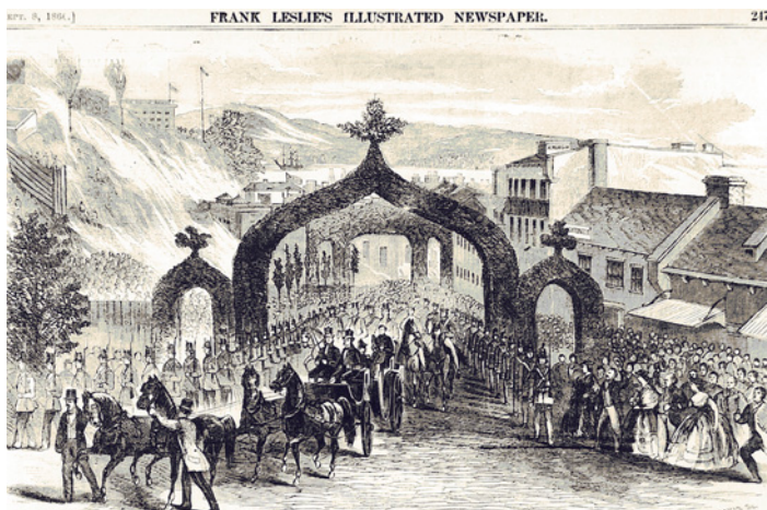
VISITE DU PRINCE DE GALLES À QUÉBEC EN 1860.

Québec est le seul port de mer et la seule ville de commerce du Canada; c'est d'ici que tous les produits du pays sont exportés. [...] Les vaisseaux peuvent y mouiller à l'aise et en sûreté dans vingt-cinq brasses d'eau et sur un fond excellent pour l'ancrage. [...] Les marchands s'habillent fort élégamment et poussent la somptuosité dans les repas jusqu'à la folie. Les femmes sont tous les jours en grande toilette et parées autant que pour une réception à la cour (Voyage de Kalm en Amérique, 1880).