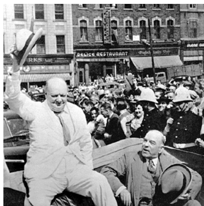
WINSTON CHURCHILL LORS DE LA SECONDE CONFÉRENCE DE QUÉBEC, 1944.

Archives nationales du Québec, Roger Bédard, P600, S6, P431 (1943).4.