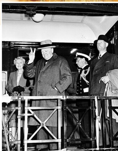
WINSTON CHURCHILL LORS DE LA PREMIÈRE CONFÉRENCE DE QUÉBEC, 1943.