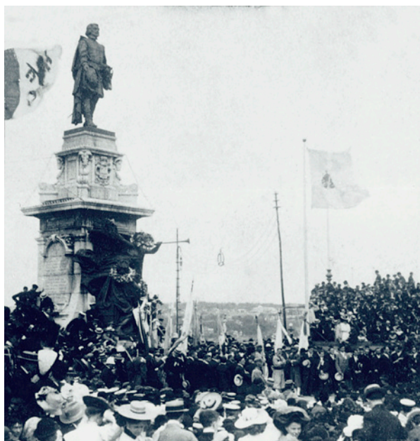
LES FÊTES DU TRICENTENAIRE DE QUÉBEC AU PIED DU MONUMENT CHAMPLAIN, 1908.

Voici un extrait de la lettre de Pie XI au cardinal Villeneuve, archevêque de Québec, le constituant son légat au Congrès eucharistique national de Québec.