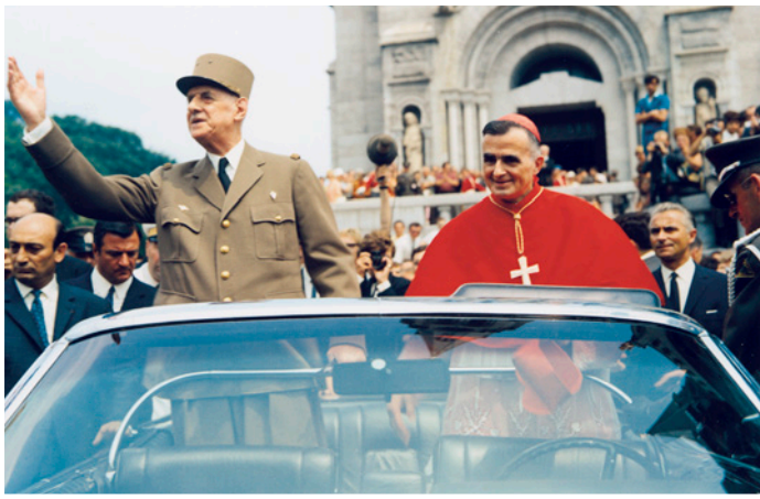
CHARLES DE GAULES À LA BASILIQUE DE SAINTE-ANNE DE BEAUPRÉ, 1967. E6, S7, P6711190.