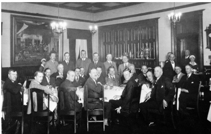
CHARLES LINDBERG AU CERCLE DE LA GARNISON, 1928.

Les chanteurs sont aussi fort nombreux à s'être produits sur les scènes artistiques de Québec, notamment celles du Palais Montcalm et de « Chez Gérard » : Édith Piaf (mai 1955), Jacques Brel (novembre 1965), Léo Ferré (février 1970), Nana Mouskouri (janvier 1967 et novembre 1970) et Georges Moustaki (janvier 1971).