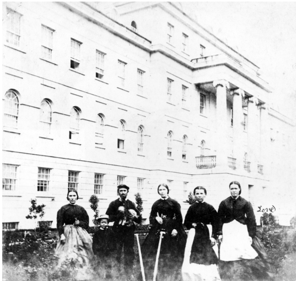
HÔPITAL DE LA MARINE À LA FIN DU XIX e SIÈCLE.