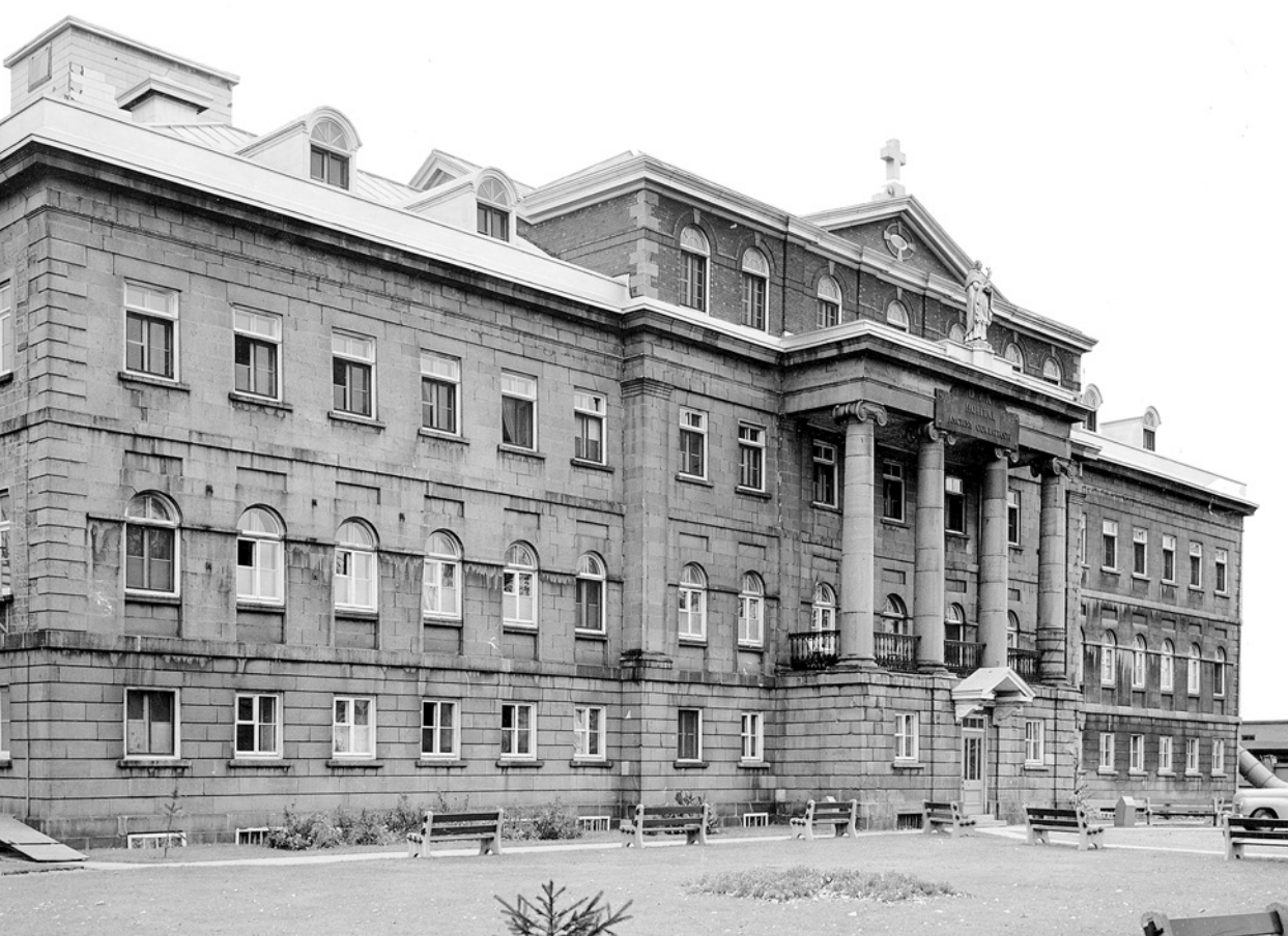
HÔPITAL DES ANCIENS-COMBATTANTS DE QUÉBEC : ANCIEN HÔPITAL DE LA MARINE VERS 1950.