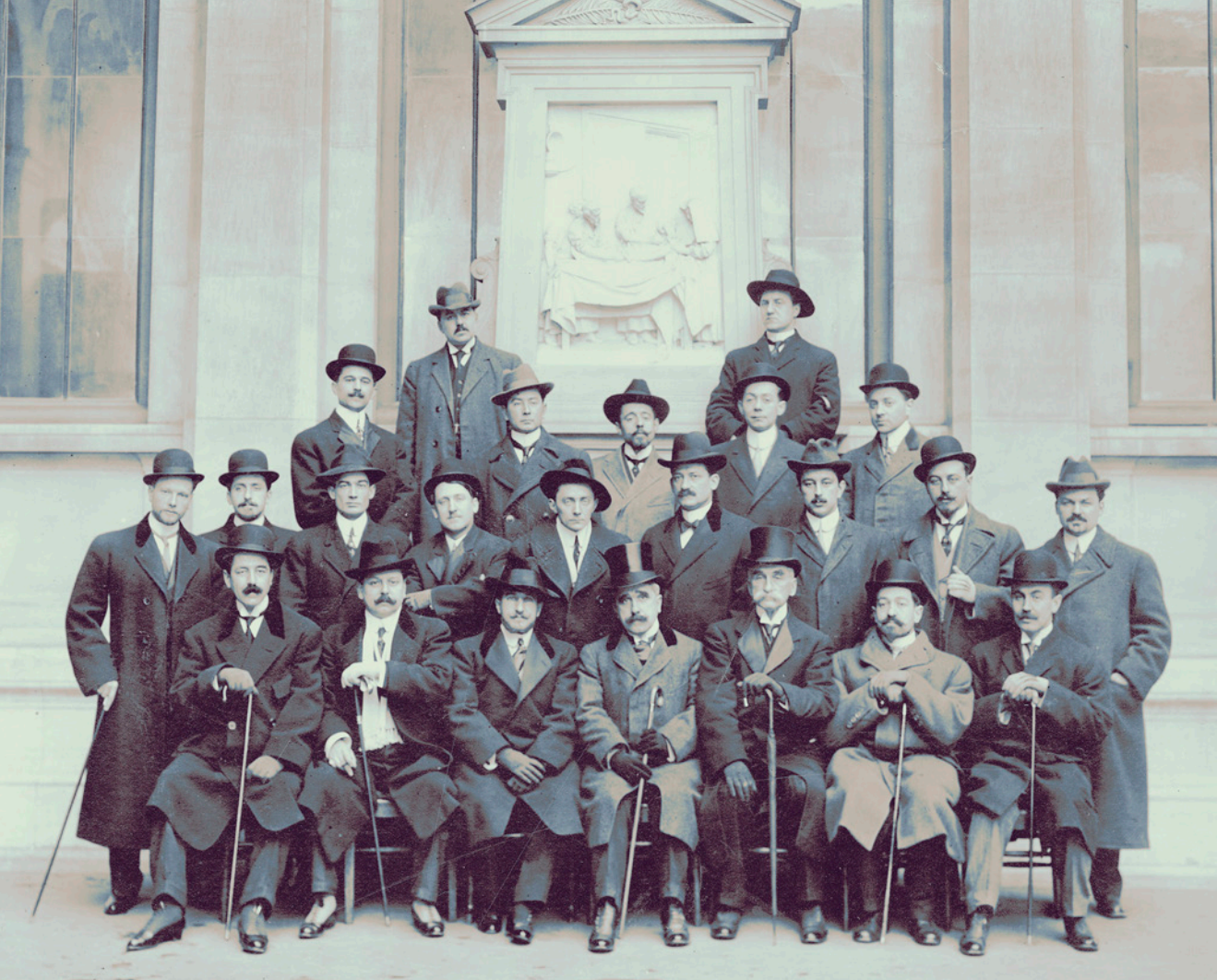
MÉDECINS CANADIENS À PARIS EN 1912.