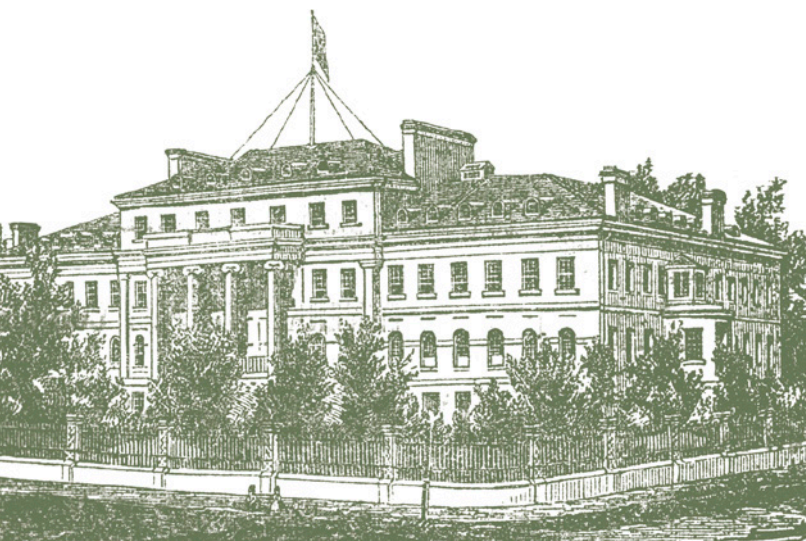
HÔPITAL DE LA MARINE, 1858. Archives nationales du Québec, N973-43.

Dans ce contexte, des hôpitaux de Québec commencèrent à ouvrir leurs portes aux étudiants en médecine. Les deux premiers furent l'hôpital des Émigrés en 1823 et l'hôpital de la Marine en 1834. Grâce à cette formation auprès des malades, les étudiants purent acquérir une bien meilleure connaissance du corps humain, de son fonctionnement et des séquelles laissées par la maladie.