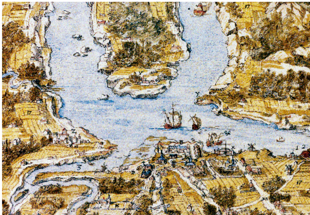
L'ENTRÉE DE LA RIVIÈRE DE ST LAURENT, ET LA VILLE DE QUÉBEC DANS LE CANADA (DÉTAIL).

En 1746, Hocquart procède à de nombreuses expropriations et interdit toute nouvelle construction aux abords du futur chantier. Tout comme au chantier du Palais, il fait aménager des ateliers pour la fabrication des voiles, des cordages, des poulies et des gréements. Cependant, comme plusieurs ateliers demeurent près de l'ancien chantier, les déplacements se multiplient et la tentation est forte pour les ouvriers de s'arrêter dans les tavernes à proximité des chantiers.