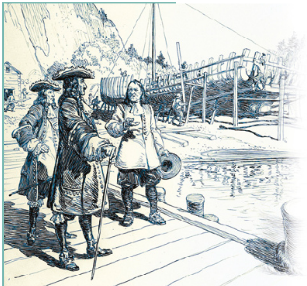
TALON INSPECTING SHIP-BUILDING AT QUEBEC, QUEBEC.

Champlain, qui constate que la colonie renferme toutes les ressources nécessaires à la construction navale, est le premier à construire une barque à Québec. Bien que plusieurs habitants construisent des barques et des chaloupes à des fins domestiques au XVII e siècle, ce n'est pas avant l'arrivée de l'intendant Jean Talon en 1665 que la construction navale s'organise à Québec. En 1666, un premier chantier voit le jour. On y construit quatre bâtiments pour le roi, entre 1666 et le départ de Talon, en 1672. Parallèlement, l'intendant fait la promotion de la construction navale chez les particuliers. Un de ses grands objectifs est de développer le commerce avec les Antilles et la France. Trois bâtiments conçus à ces fins seront construits sous Talon : un pour l'intendant lui-même et deux pour le marchand Charles Aubert de La Chesnaye.