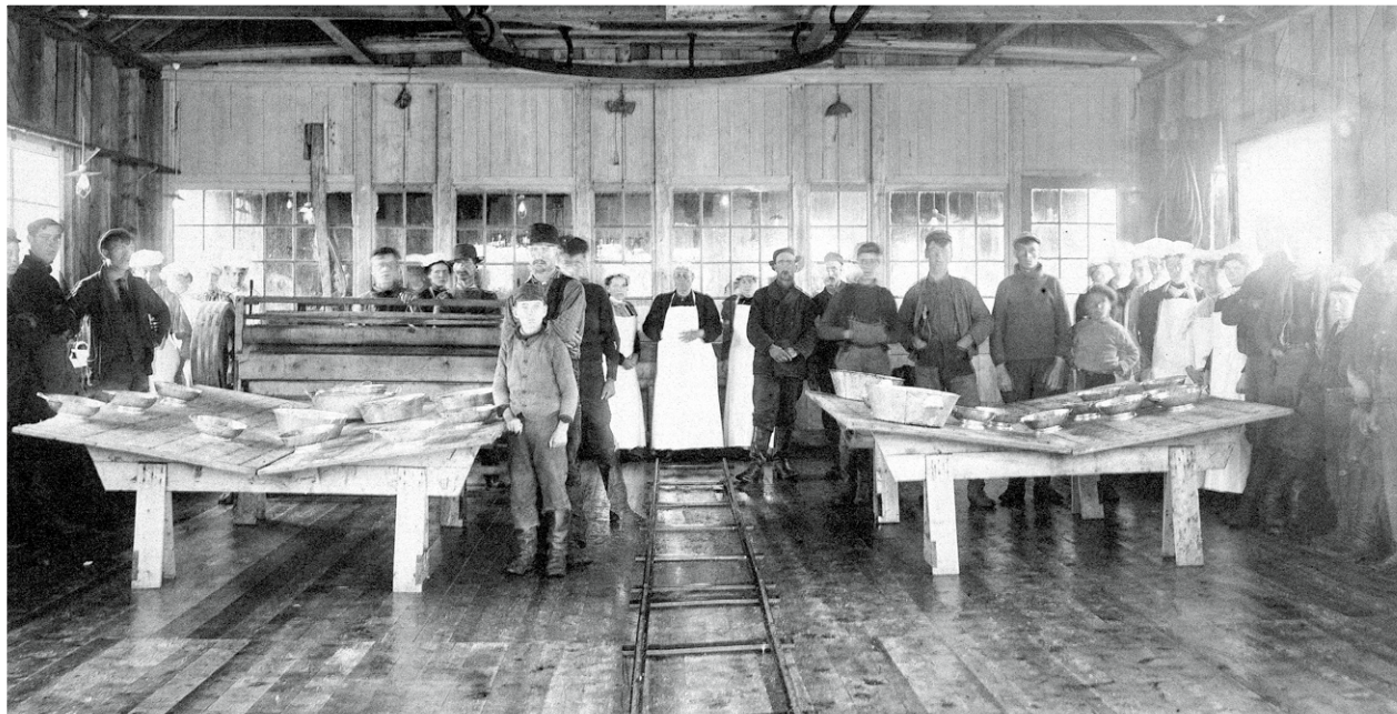
▲ VOYAGE DU YACHT BACCHANTE À L'ÎLE D'ANTICOSTI : EMPLOYÉS À L'INTÉRIEUR DE LA HOMARDERIE (BAIE AUX RENARDS), 1901 Bibliothèque et Archives nationales du Québec (Québec), P186, S1, D3, P38

en 1895, l'industriel français Henri Menier chasse 70 Anglais de la Baie aux Renards. C'est ainsi qu'au recensement de 1901, la quasi-totalité des Anticostiens, soit 432 personnes sur 442, sont catholiques et de langue française.