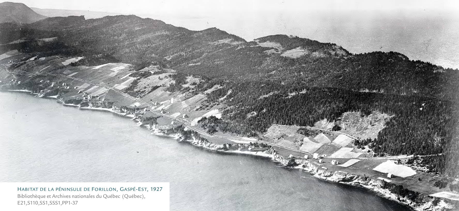
HABITAT DE LA PÉNINSULE DE FORILLON, GASPÉ-EST, 1927

égard éloquentes pour la côte nord-gaspésienne : 81 des 403 pionniers installés dans ce secteur entre 1870 et 1890 s'adonnent d'abord à l'agriculture et 31 autres joignent cette occupation à la pêche. Le nombre de fermes pour le seul comté de Gaspé est de 4854 unités en 1901 et de 5304 en 1920. Pour leur part, les activités forestières deviennent plus qu'un complément à l'économie domestique. En 1870, vingt-cinq moulins à scie et à raboter sont en activité entre Sainte-Anne-des-Monts et Cap-des-Rosiers. En 1914, le comté de Gaspé en compte vingt-huit, dont seize appartiennent à des Canadiens français. Cinq sont installés à Sainte-Anne-des-Monts, autant à L'Anse-au-Griffon et de même au Grand-Pabos. S'ajoutent à ces unités de production plusieurs usines de pâte à papier après 1900. Entre 1901 et 1920, les employés de la James Richardson de Cap-Chat préparent, selon certains, un milliard de cordes de bouleau de quatre pieds destinées à la fabrication des fuseaux de fils en Angleterre. La St. Lawrence Pulp and Lumber Corporation à Pabos et la Great Eastern Paper Company à La Madeleine, apparues à la fin de la Première Guerre, emploient