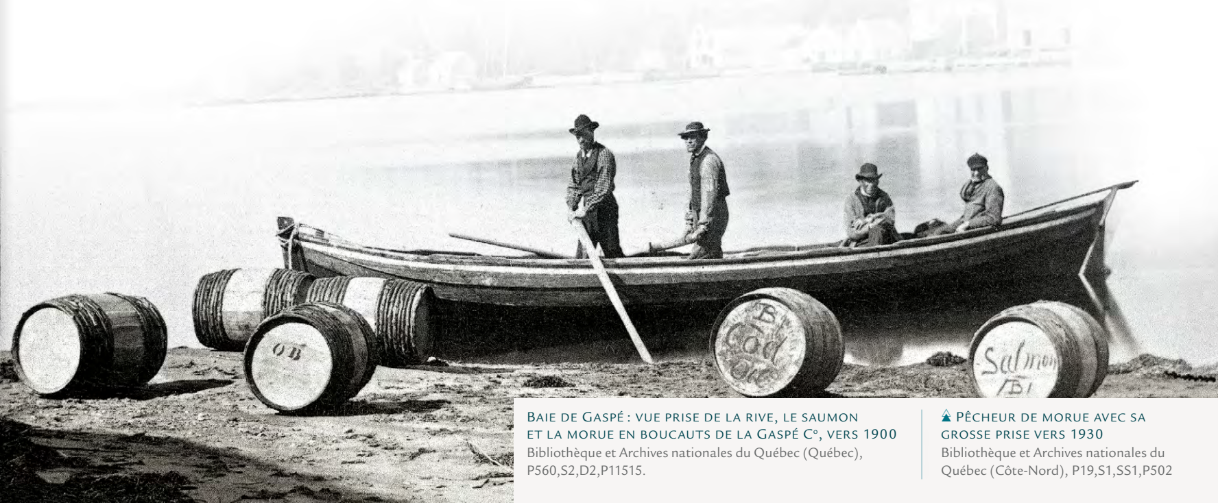
BAIE DE GASPÉ : VUE PRISE DE LA RIVE, LE SAUMON ET LA MORUE EN BOUCAUTS DE LA GASPÉ C o , VERS 1900 Bibliothèque et Archives nationales du Québec (Québec), P560,S2,D2,P11515.