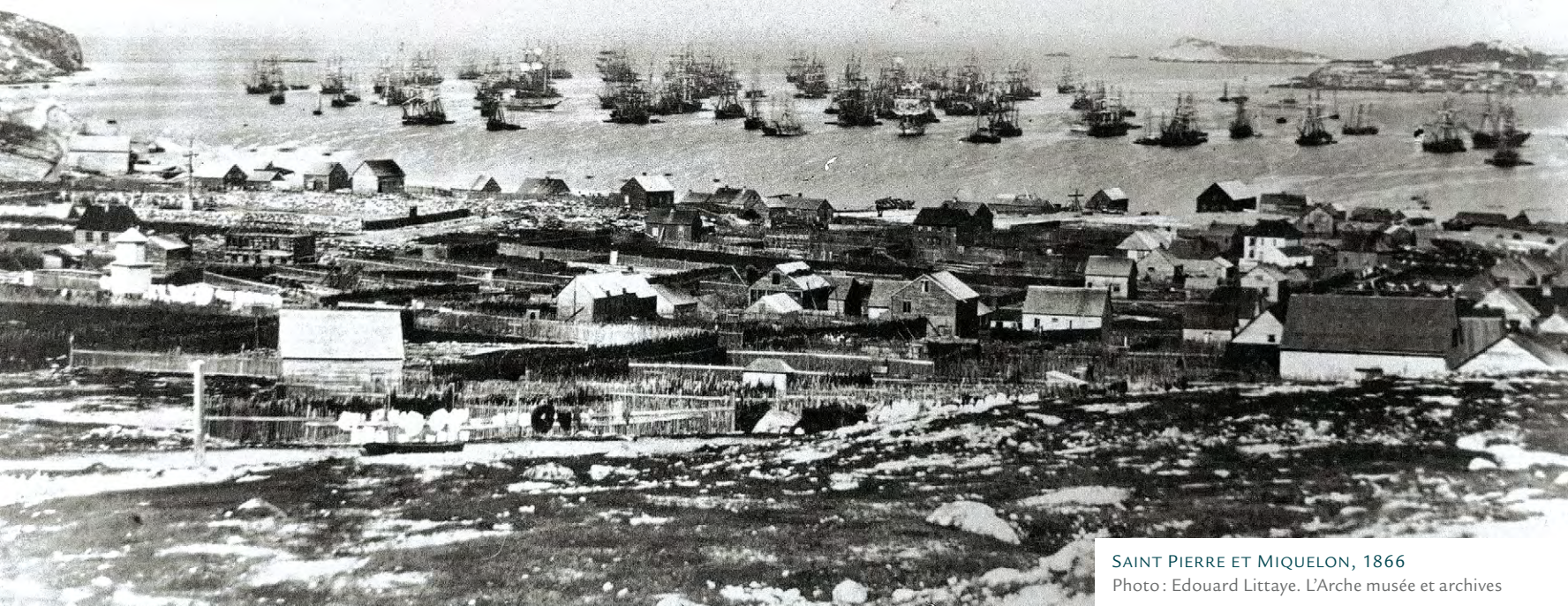
SAINT PIERRE ET MIQUELON, 1866

Les années 1860 connaissent un élan économique avec la reprise de la Grande Pêche. Chaque année, 3 500 pêcheurs et marins débarquent de France alors que ceux des îles travaillent comme tiers pour des armateurs locaux. Des industries complémentaires leur apportent une certaine autonomie. En 1900, on trouve à Saint-Pierre une manufacture de cirés pour les marins, une fonderie et une biscuiterie. Il y a des cales sèches sur le Barachois et, tout près, on fabrique des boucauts (tonneaux) et on construit des doris. L'économie locale est toutefois victime d'une crise en 1904. La French Shore terre-neuvienne, cédée en 1763 aux Français, est alors abandonnée par la métropole. Résultat : le déclin de la Grande Pêche, l'année suivante, réduit les insulaires à la famine.