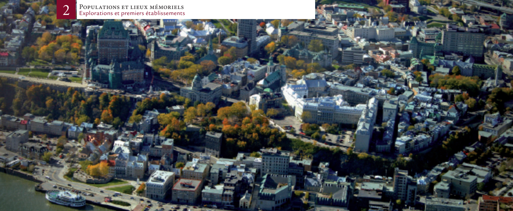
▲ Le Vieux-Québec, aujourd'hui. Sur les hauteurs, le Château Frontenac et le Séminaire dominent la basse ville. Au pied du Château, Place-Royale, où tout a commencé.