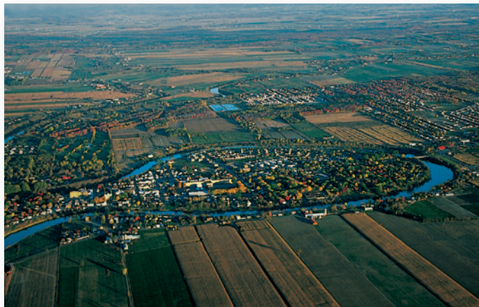
◀ Ensermée dans un méandre de la rivière du même nom, la ville de l'Assomption, à l'aval de Montréal sur la rive gauche du fleuve, participe de l'urbanisation péri-métropolitaine enracinée dans le terroir fertile de la plaine montréalaise. Signes de l'étalement urbain affectant le secteur, des lotissements récents s'étendent vers l'est et le nord.

Les paysages humains contemporains sont également marqués par la diversité culturelle. À la majorité d'origine canadienne-française (80 % de la population) et aux Premières Nations (sept nations établies dans le Québec méridional en plus des quatre mentionnées précédem-