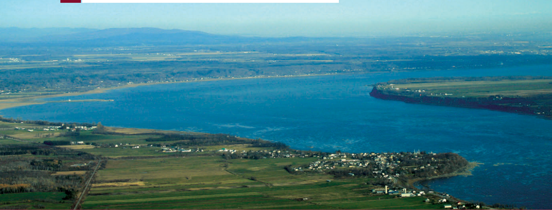
▲ L'un des rares méandres du fleuve Saint-Laurent, à l'aval immédiat du village de Deschambault (à l'avant plan) entre Trois-Rivières et Québec. La plaine agricole est limitée par les contreforts des Laurentides, au fond à gauche.