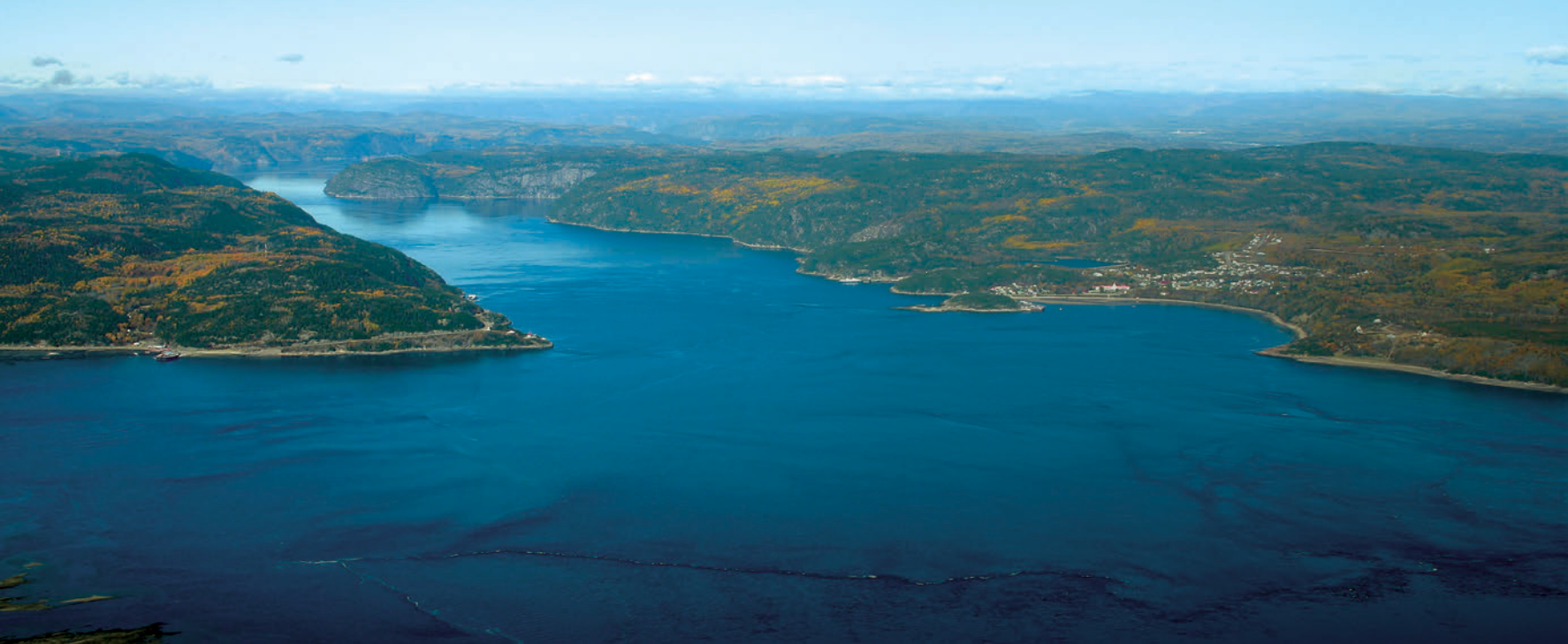
▲ L'embouchure de la rivière Saguenay, drainant une partie du plateau laurentien vers l'estuaire du Saint-Laurent, est encadrée par la baie Sainte-Catherine, à gauche, et celle de Tadoussac.