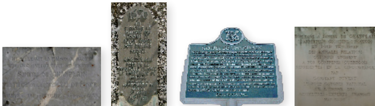
▲ Brouage, plaques et stèles commémoratives de Champlain, sur le site de l'actuelle Maison Champlain.

C'est à la fin du XIX e siècle que le personnage de Champlain refait surface dans l'ancienne cité maritime. En 1874, l'artiste oléronais Omer Charlet propose au Conseil général de la