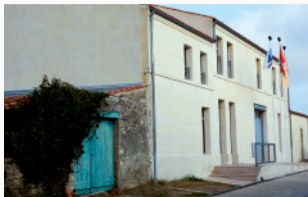
◀ Brouage, la Maison Champlain

Pour le Conseil général de la Charente-Maritime, il y avait là un fort potentiel patrimonial et mémoriel à valoriser sur le plan culturel et touristique et ce, d'autant plus qu'il s'inscrivait dans un « site naturel » de première importance pour la côte atlantique : les marais de Brouage, dont les richesses animalières et paysagères constituent un puissant facteur d'attrait en elles-mêmes. Les initiatives individuelles – du père Le Grelle aux universitaires – pour documenter l'histoire des relations entre la citadelle et la Nouvelle-France, le travail de sensibilisation mené depuis des décennies par diverses associations ouvertes sur le Canada, ont ainsi été relayées par les collectivités territoriales, sources d'un investissement financier conséquent. De fait, tout convergeait – les faits historiques, un personnage hors du commun, des intérêts mémoriels divers et variés, la restauration et la préservation de la citadelle (délaisée dès le xviii e siècle) ainsi que la nécessité de contribuer à son animation pour inciter les responsables politiques et institutionnels à (re)donner au site de Brouage une « identité » canadienne avec les retombées potentielles que représente sa valorisation sur le plan du développement local.