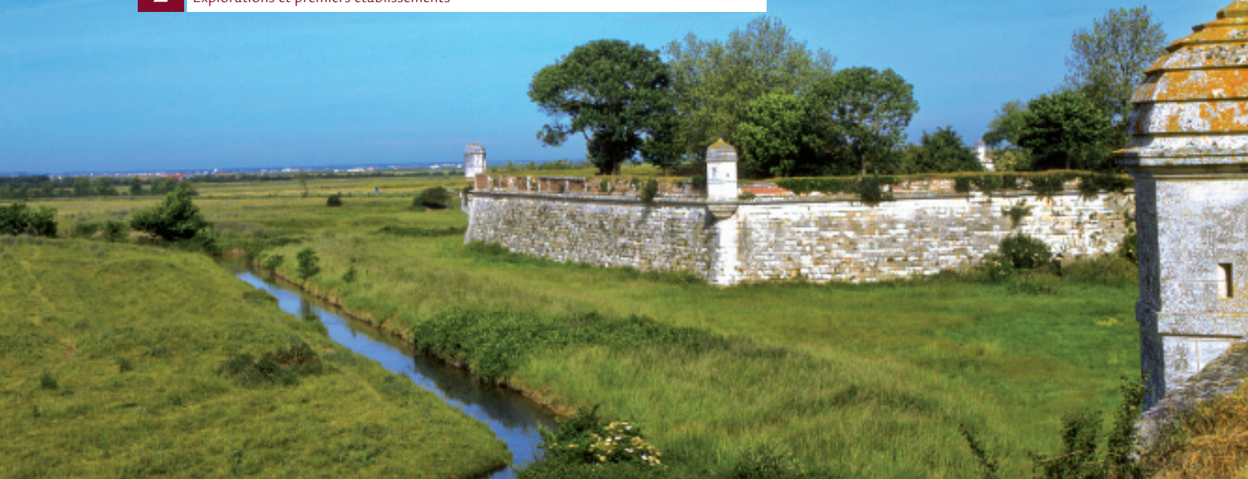
▲ Brouage, le marais depuis les remparts