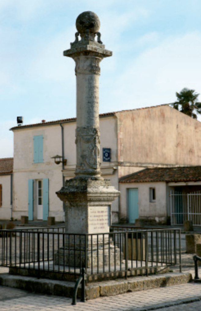
▲ Brouage, monument commémoratif de Champlain.