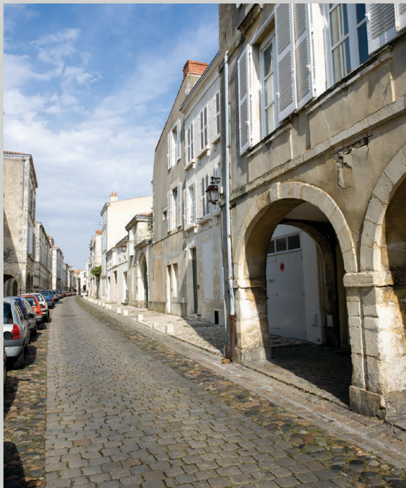
► La Rochelle, la rue de l'Escale

sont visibles en parement intérieur et extérieur du mur pignon sud du moulin des Loges. Il s'agit de laves dites « basaltes alcalins à olivine », sans marques significatives d'altération. Elles ont été utilisées comme réfractaire pour un mur incluant une cheminée et sont absentes des autres murs.