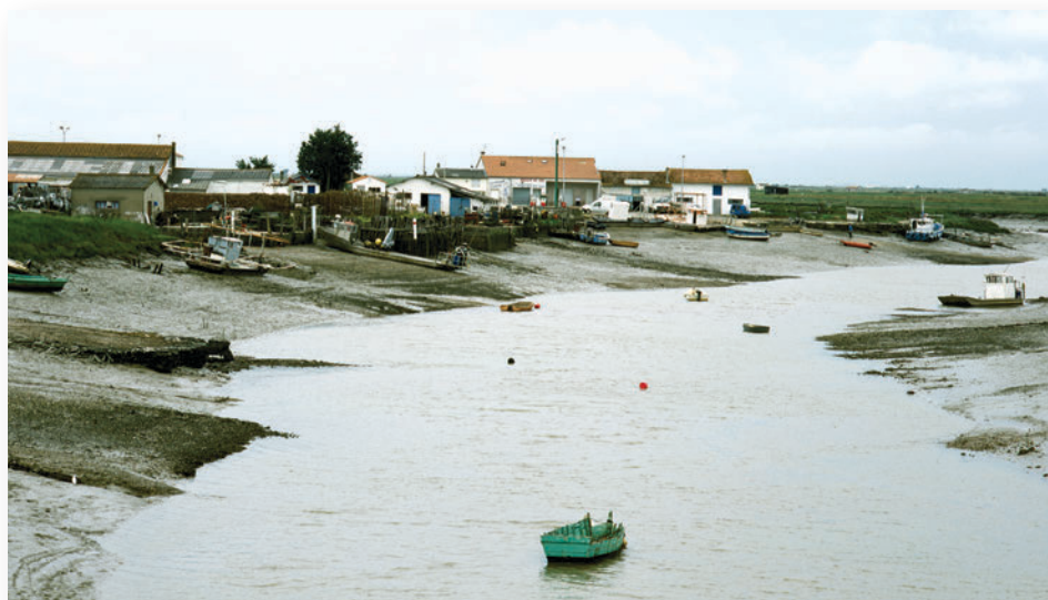
▶ La Seudre de nos jours, à marée basse

ou Bonnefou de Marennes s'y sont aussi illustrées. Chaque année de paix entre 1749 et 1793, entre un et cinq navires ont ainsi quitté la Seudre pour le Grand Banc ou Miquelon. En tout, une cinquantaine de navires ont déchargé leur morue verte sur le marché rochelais. Les équipages de la Seudre constituaient de véritables villages embarqués sous les ordres de capitaines du cru, parmi lesquels la famille Touzeau, apparemment fortement impliquée, sur plusieurs siècles, dans la pêche à la morue.