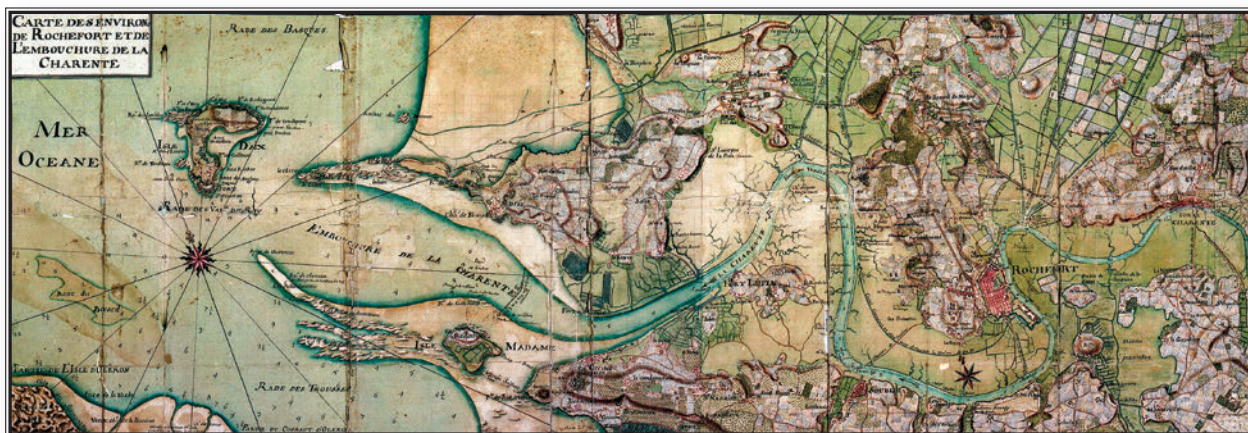
▲ Carte de l'embouchure de la Charente, 1776

à de nouvelles formes de mise en valeur de ses rives, en lien étroit avec les politiques d'amélioration du cadre de vie (aménagement urbains et paysagers), le développement des loisirs et du tourisme : visites à vocation patrimoniale, randonnées pédestres et cyclistes, bases nautiques, croisières fluviales, animations diverses. Saint-Simon, dans l'actuel département de la Charente, joue ainsi de son histoire et de son patrimoine pour retrouver un nouveau souffle, et ce grâce aux efforts de l'association « Saint-Simon Village Gabarier », dont le nom entend donner au village une identité propre. Au XVIII e siècle, Saint-Simon était l'un de ces villages particulièrement actifs qui vivaient du trafic fluvial : on y construisait des gabarres et ses marins sillonnaient la Charente jusqu'à Rochefort ou Angoulême pour y transporter passagers et marchandises diverses. C'était également une étape pour les autres gabarriers qui savaient y trouver quais et ravitaillement, ainsi qu'un personnel qualifié pour l'entretien et la réparation de leurs embarcations. Elle s'intègre désormais dans la manifestation organisée chaque année, depuis 2003, par une autre association, « La Route des Tonneaux et des Canons »,