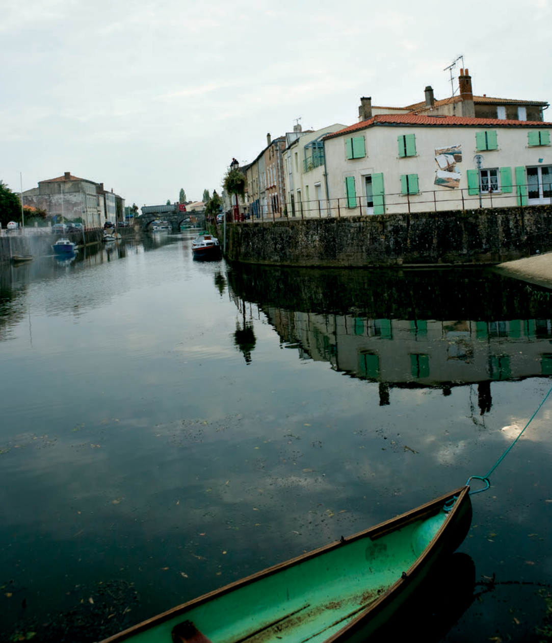
◀ La Sèvre Niortaise à Marans