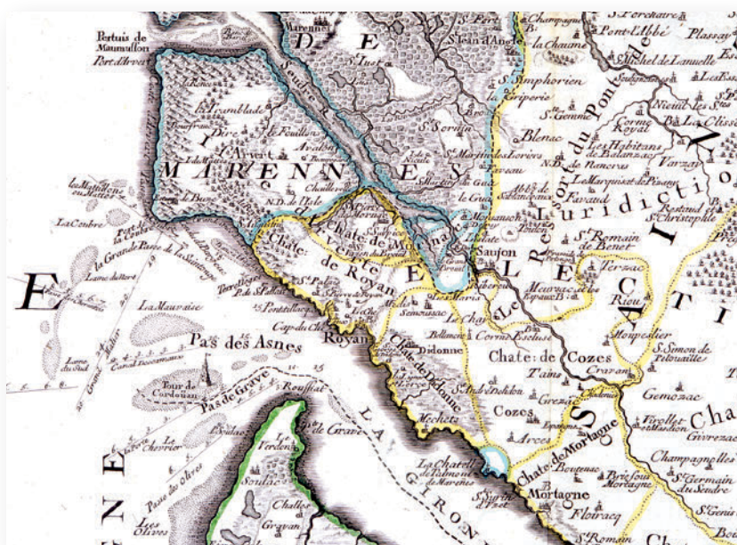
◀ Détail de la région de Marennes tiré de la carte de Nodin, « La généralité de La Rochelle comprenant le Pays d'Aunis, la Saintonge et divisée en cinq élections », 1700