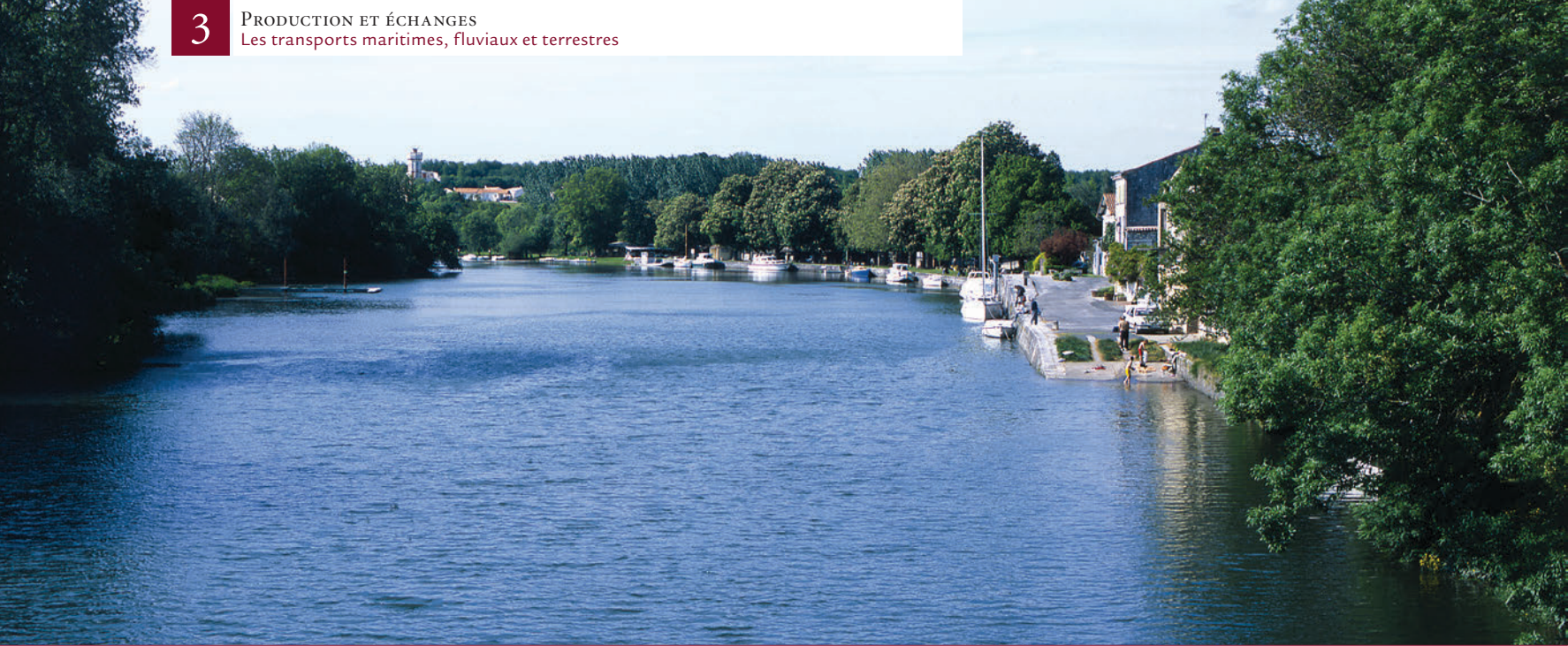
▲ La Charente à Port d'Envaux