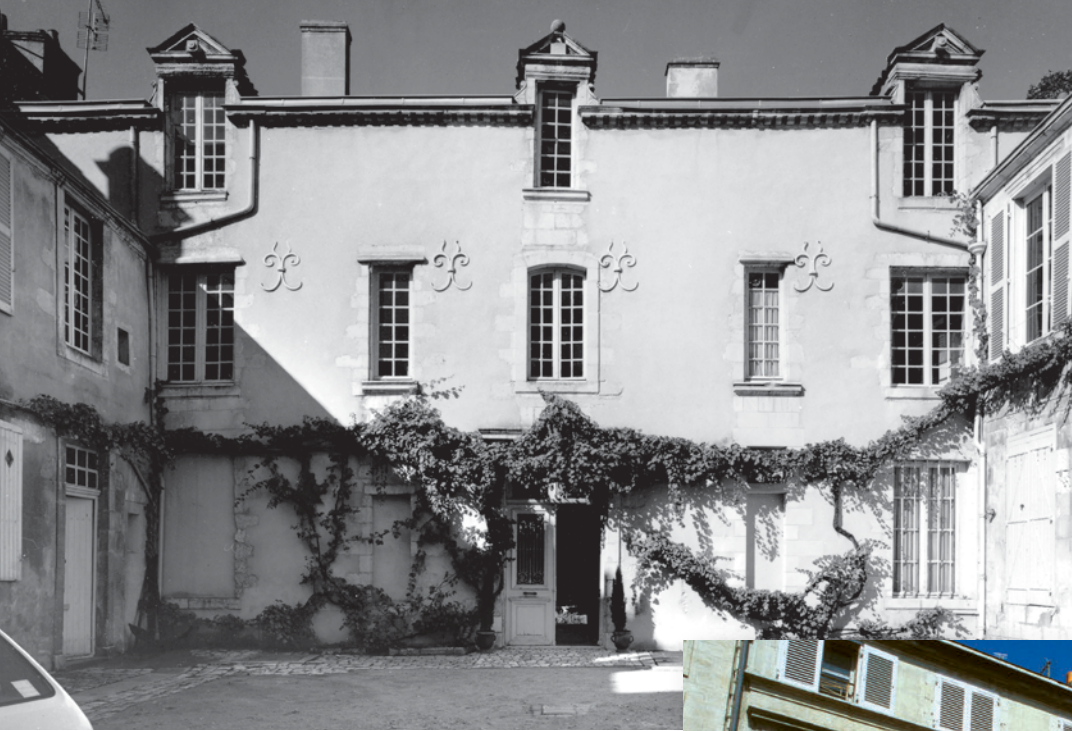
▲► La Rochelle, 16 rue Réaumur, Hôtel Giraudeau