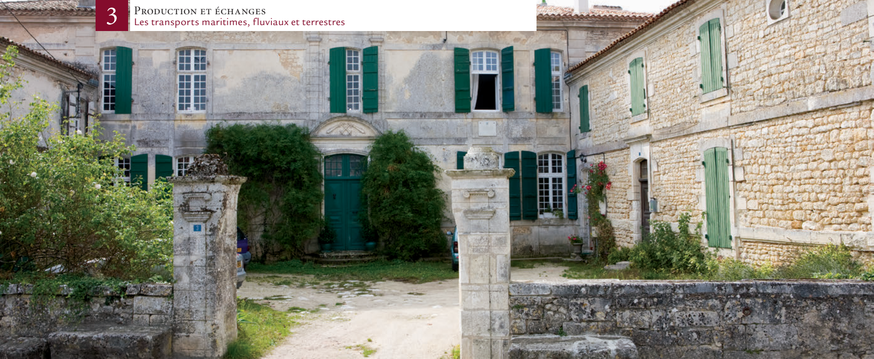
▲ Nieulle-sur-Seudre, ancienne demeure d'Isaac Garesché fils