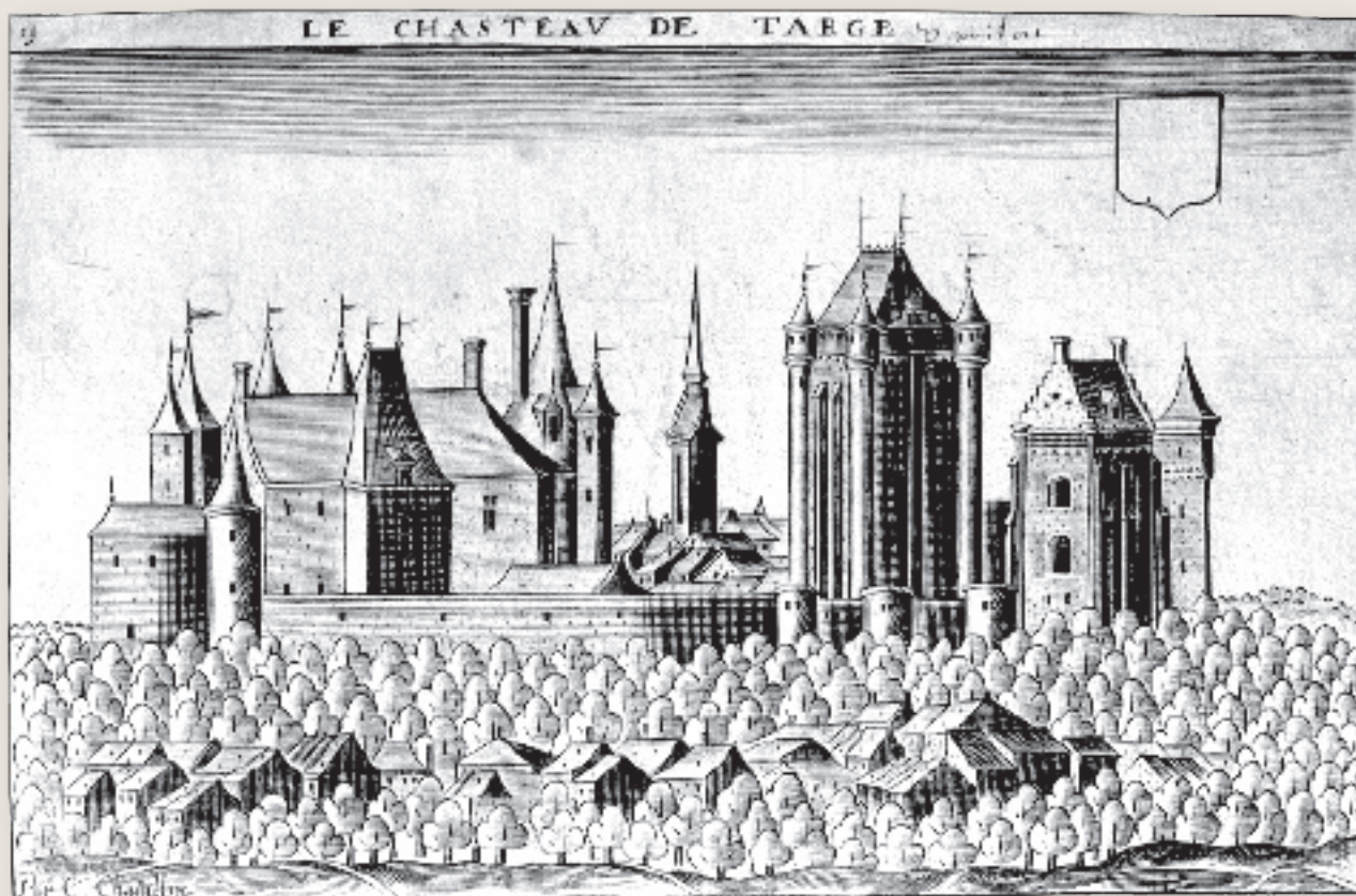
▲ Le Château de Targé, gravure de Claude Chastillon (1560-1616), Topographie française [détail]