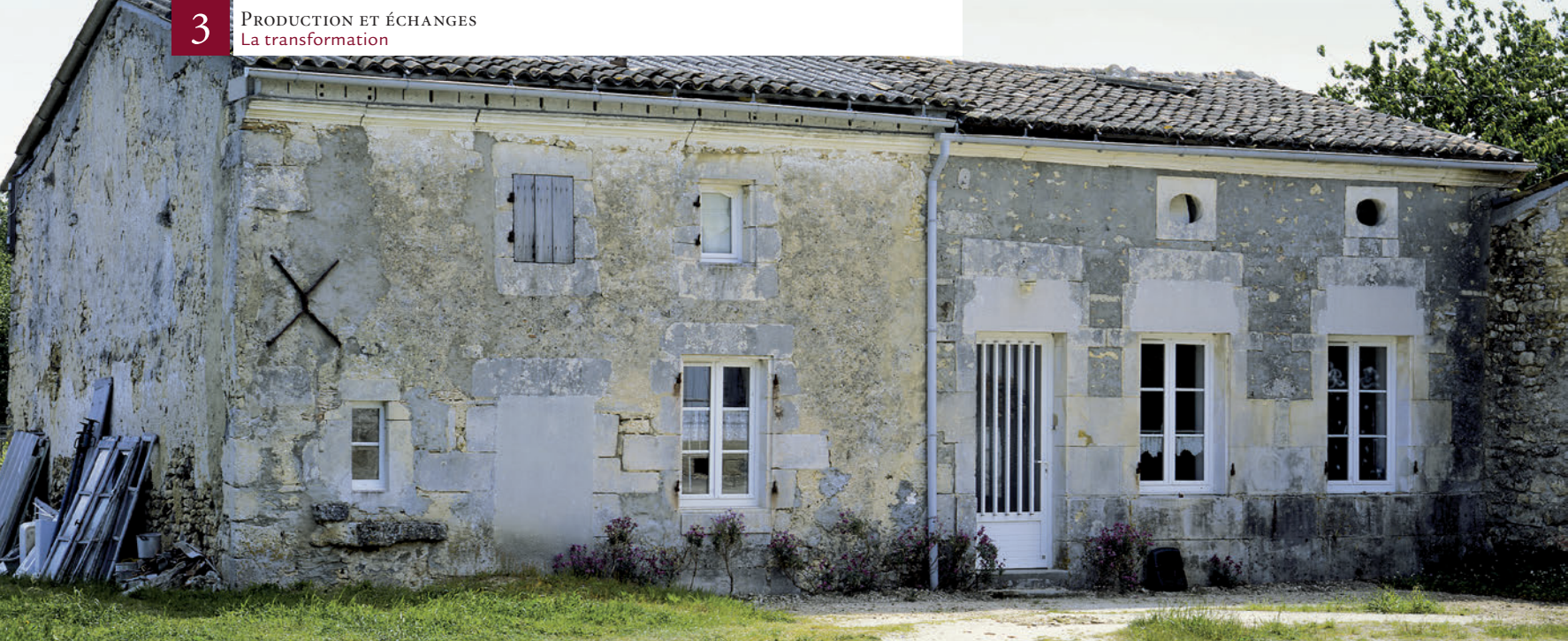
▲ Écoyeux, rue des Bouleaux, maison dite de la famille Jean

Son extrémité est, datant peut-être d'avant 1817, est en ruine, laissant peu sinon pas de traces antérieures au XIX e siècle.