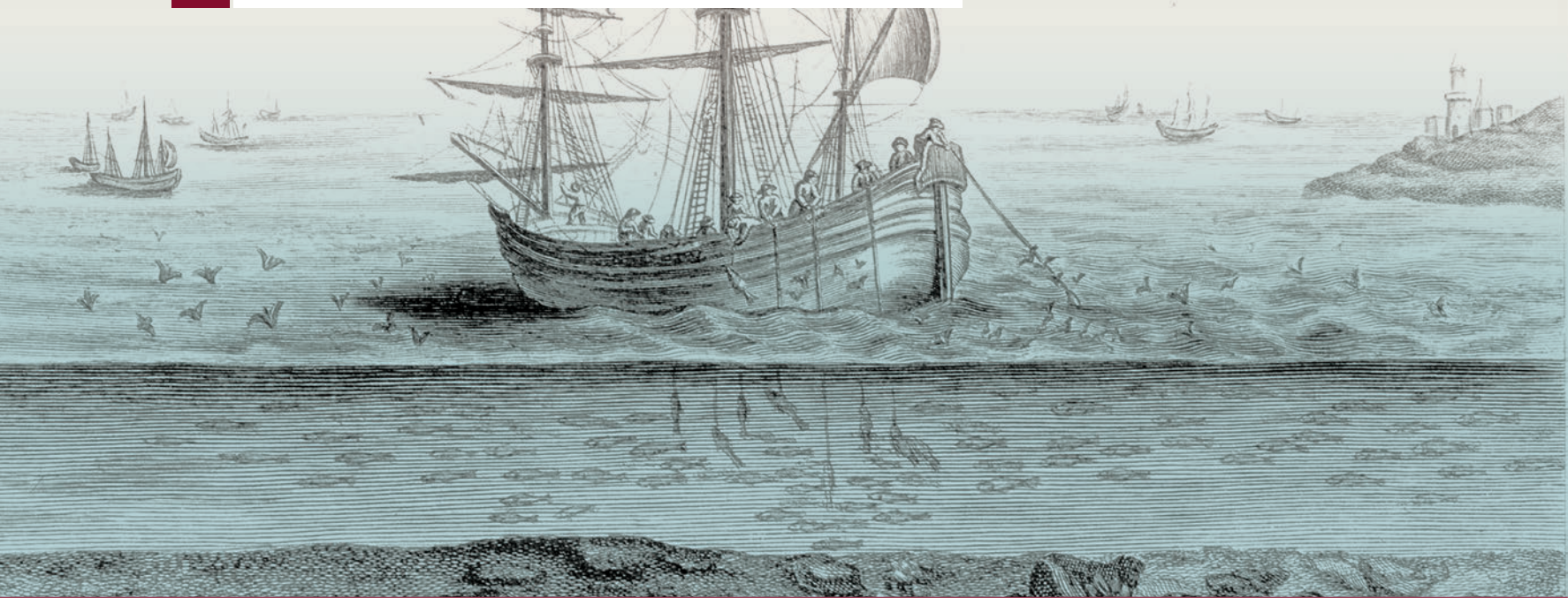
▲ « Pêche à la morue sur les bancs de Terre-Neuve ». Duhamel Dumonceau, Traité général des pêches , 1772, planche XIII [détail] © Bibliothèque et Archives Canada