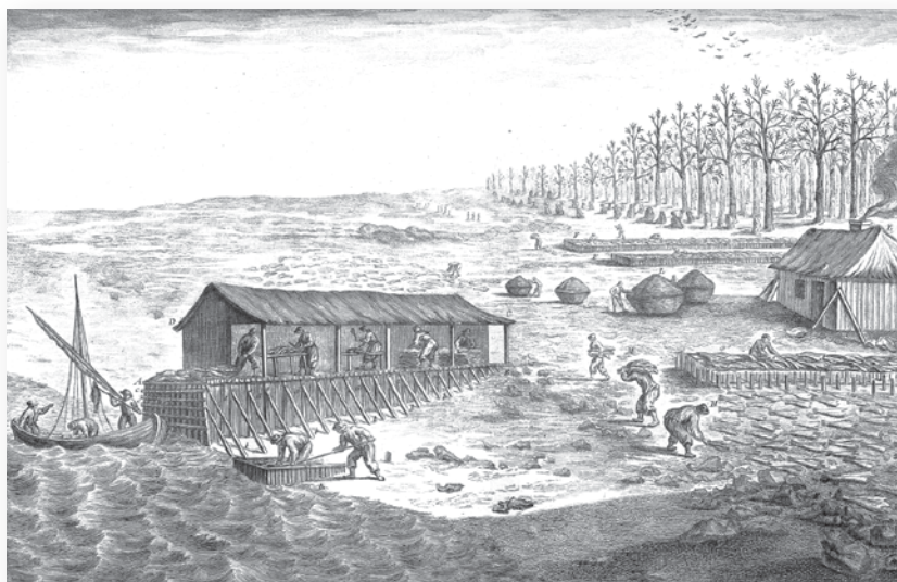
◀ « Séchage de la morue dans le golfe Saint-Laurent », Duhamel du Monceau, Traité général des pêches , planche XVIII.