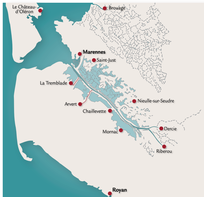
▲ Les ports de l'estuaire de la Seudre liés à la Nouvelle-France (armement à la pêche à la morue, équipages morutiers) Conception : Thierry Sauzeau, réalisation : Zoé Lambert, 2007

Les ports de l'actuel département de la Charente-Maritime étaient tous plus ou moins concernés par cette activité : armement de navires, fourniture de sel, redistribution de la précieuse denrée ou encore mobilisation des équipages. La Rochelle a bien sûr joué à ce titre un rôle central. Marché ou entrepôt, la capitale de la province d'Aunis était riche en capitaux, en avitaillement et en sel, trois éléments essentiels à la réussite d'une campagne. Le poisson frappe moins l'imaginaire que l'argent du Pérou, mais il a occupé des flottes bien plus considérables et impliqué 10 à 15 milliers de marins français chaque année de paix, sous l'Ancien Régime.