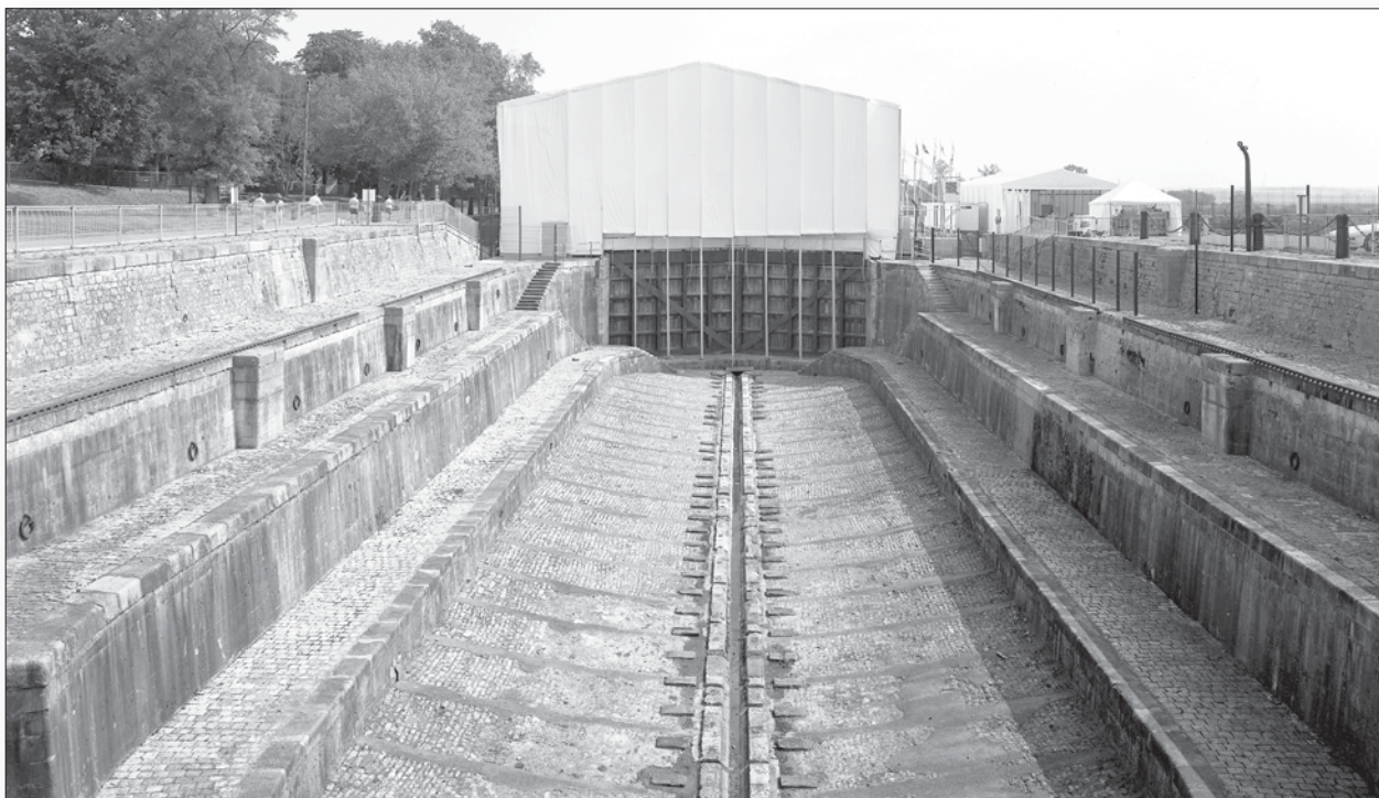
▲ Rochefort, la Forme double (1997)