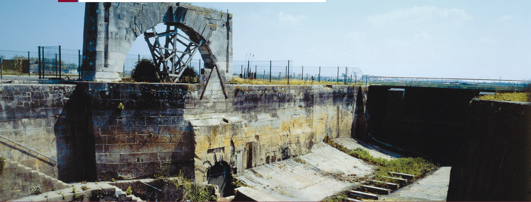
▲ Rochefort, la Vieille Forme

Il s'agit de la première « forme » (bassin épousant la forme d'une carène de navire) maçonnée que l'on connait. Elle est construite à l'extrémité nord des remparts, entre 1669 et 1671, par l'ingénieur François Le Vau. Elle est en pierre de taille, orientée perpendiculairement à la Charente, et se ferme par des portes-écluses en bois. L'arche sur la gauche abritait la roue de la machine hydraulique, installée en 1740, qui servait à épuiser l'eau du fleuve.