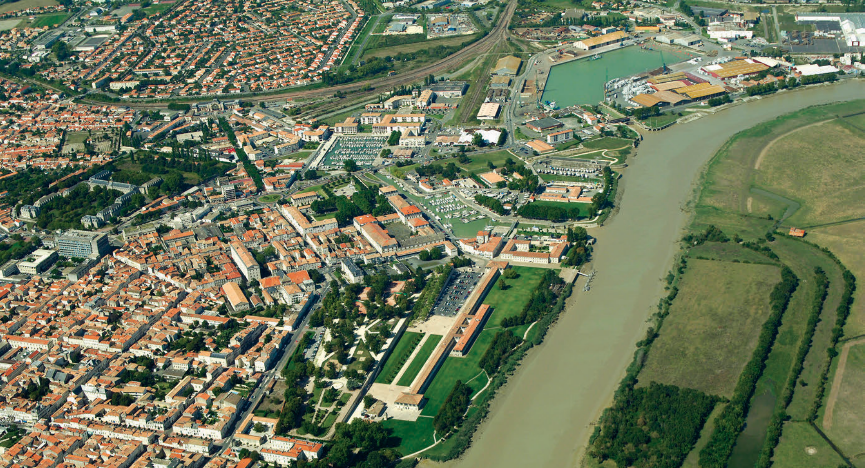
▲ Rochefort, la ville, la corderie et les premières fosses aux mâts

Les fosses forment le quadrilatère ceinturé d'arbres, sur la rive gauche de la Charente. Les plantations révèlent encore le système d'amenée d'eau. D'autres fosses aux mâts, contemporaines, se trouvaient à l'embouchure même du fleuve, sur l'actuelle commune de Saint-Nazaire, sous la protection du fort Lupin. À la fin du XIX e siècle, un vaste ensemble de fosses maçonnées fut aménagé, sur la commune d'Echillais : les fosses de la Gardette. En parfait état car quasiment inutilisées à leurs fins initiales, elles sont aujourd'hui propriété du Conservatoire du littoral.