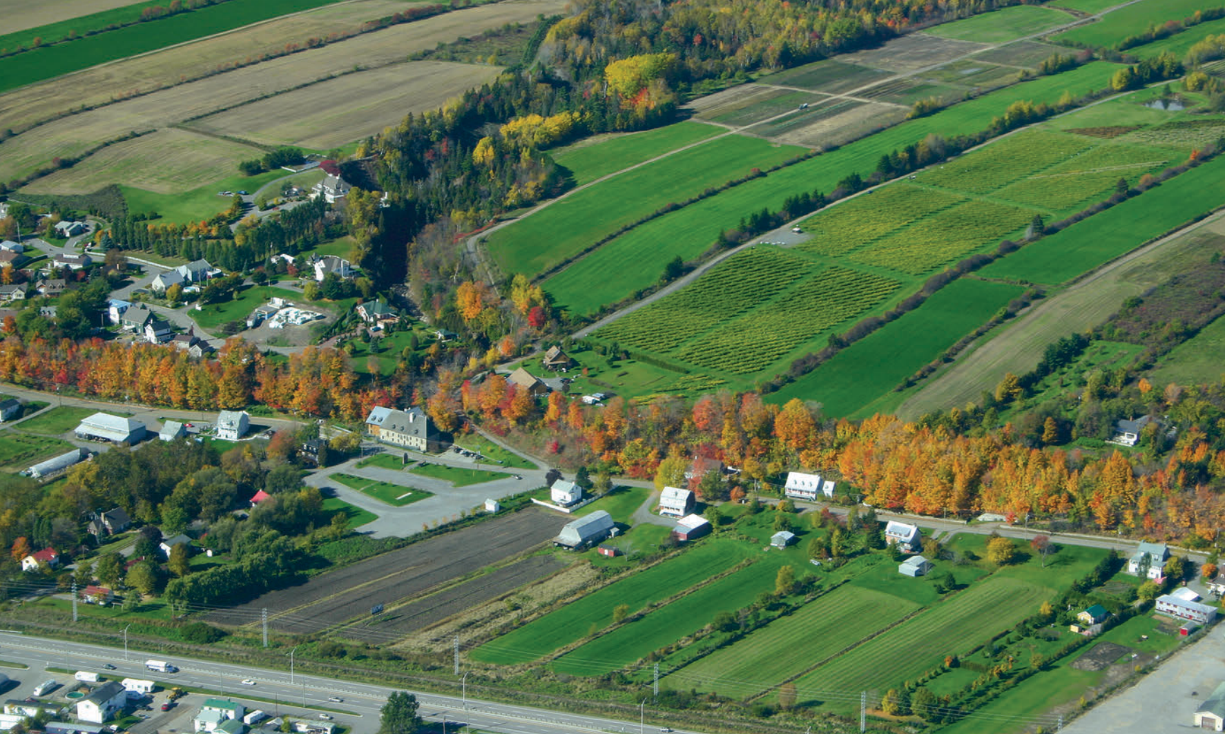
▲ Sur la rivière du même nom à Château-Richer, le moulin du Petit-Pré est construit en 1695 pour le Séminaire de Québec, alors seigneur de la Côte-de-Beaupré. Le bâtiment subit de nombreux agrandissements et modifications au fil des ans. En 1972, des fouilles archéologiques permettent de le reconstituer tel qu'il était en 1763, exception faite de la rallonge en bois, qui date de 1877. Il est ouvert au public depuis 1983.