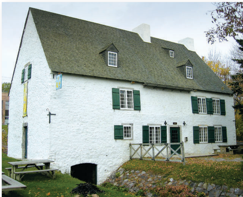
▲ Le Moulin des Jésuites est un bâtiment en pierre construit en 1740 au cœur de l'arrondissement historique de Charlesbourg. Il est demeuré en fonction jusqu'en 1940. En 1990-1991, des travaux de restauration lui redonnent son état d'origine. Il accueille depuis un centre d'interprétation.

Les moulins à vent sont assez tôt l'objet de préoccupations patrimoniales. Par exemple, en 1943, alors que l'action du gouvernement du Québec en matière de patrimoine est très limitée, il acquiert le moulin de l'hôpital général de Québec pour le préserver. Aujourd'hui, ce moulin à vent est mis en valeur par la présence d'une plaque et d'un petit parc, rappelant qu'il est le dernier survivant dans les environs de Québec. Ailleurs, cette préoccupation patrimoniale apparaît au cours des années 1970. En 1972, la municipalité de Grondines acquiert ainsi le vieux moulin présent sur son territoire. Restauré, il s'enrichit d'un centre d'interprétation en 1993.