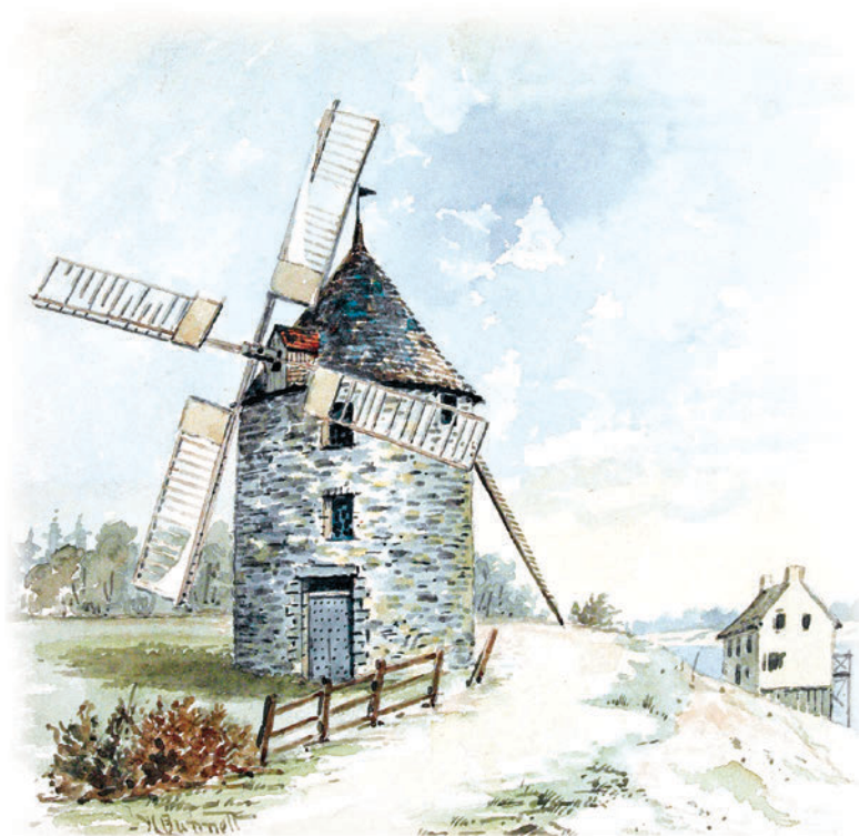
▲ Henry Richard Sharland Bunnet, « Un moulin à vent près de la rivière (Québec) », vers 1890 © Bibliothèque et Archives Canada, collection de Canadiana Peter Winkworth, acquisition R9266-56, e00120123

La majorité des moulins qui ont été conservés sont des moulins à vent. Ceci s'explique sans doute par le fait qu'à l'époque coloniale leur construction coûtait moins cher que celle d'un moulin à eau (Laperle, 2003:39). Les premiers sont érigés pour moudre les