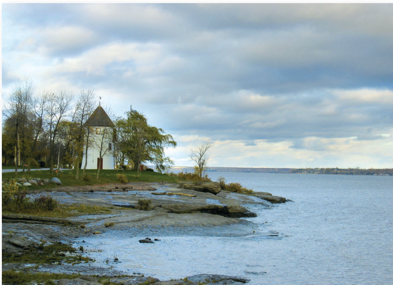
▲ Le moulin à vent de Grondines est construit par Pierre Mercereau en 1674 pour les sœurs hospitalières de l'Hôtel-Dieu de Québec. Utilisé pour moudre le grain jusqu'en 1880 environ, il sert de phare pour la navigation entre 1912 et 1972. Restauré à l'occasion de son tricentenaire, il est préservé à titre de bien archéologique classé depuis 1984.

© Samantha Rompillon / CIEQ, 2005, Q03-201