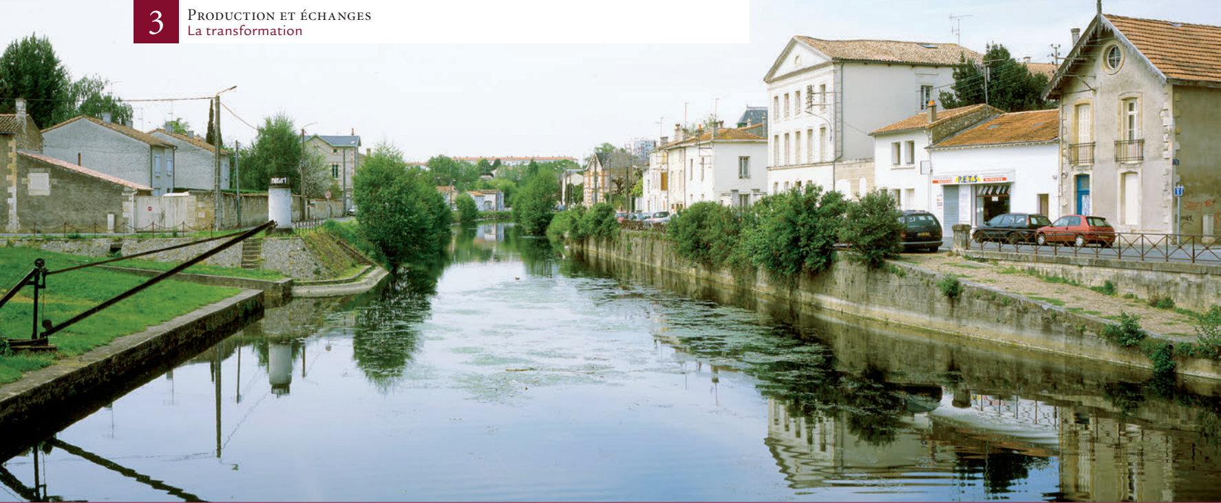
▲ La Sèvre Niortaise à Niort