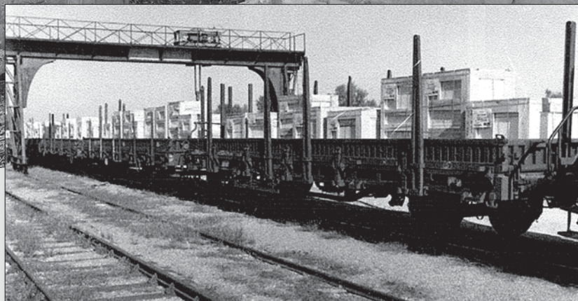
▲ Chargement de pierre de taille de l'entreprise Fèvre et Cie pour Louisbourg

Avant l'arrêt de l'activité sur le site de Saint-Même en 1975, des pierres ont été envoyées à Québec pour le Château Frontenac et, à la fin des années 1960, en Nouvelle-Écosse pour le site de la forteresse de Louisbourg.