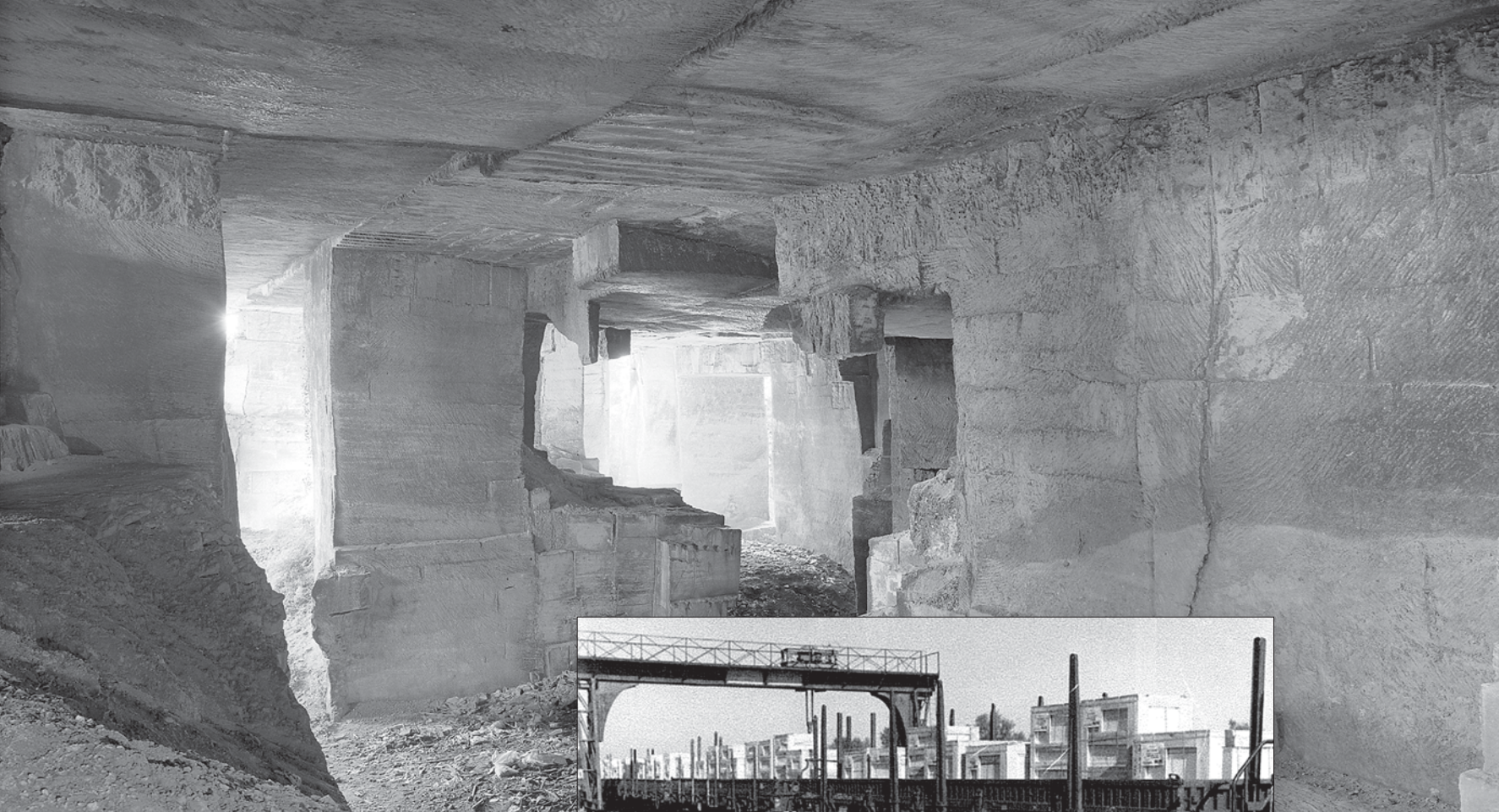
▲ Intérieur des carrières de Saint-Même