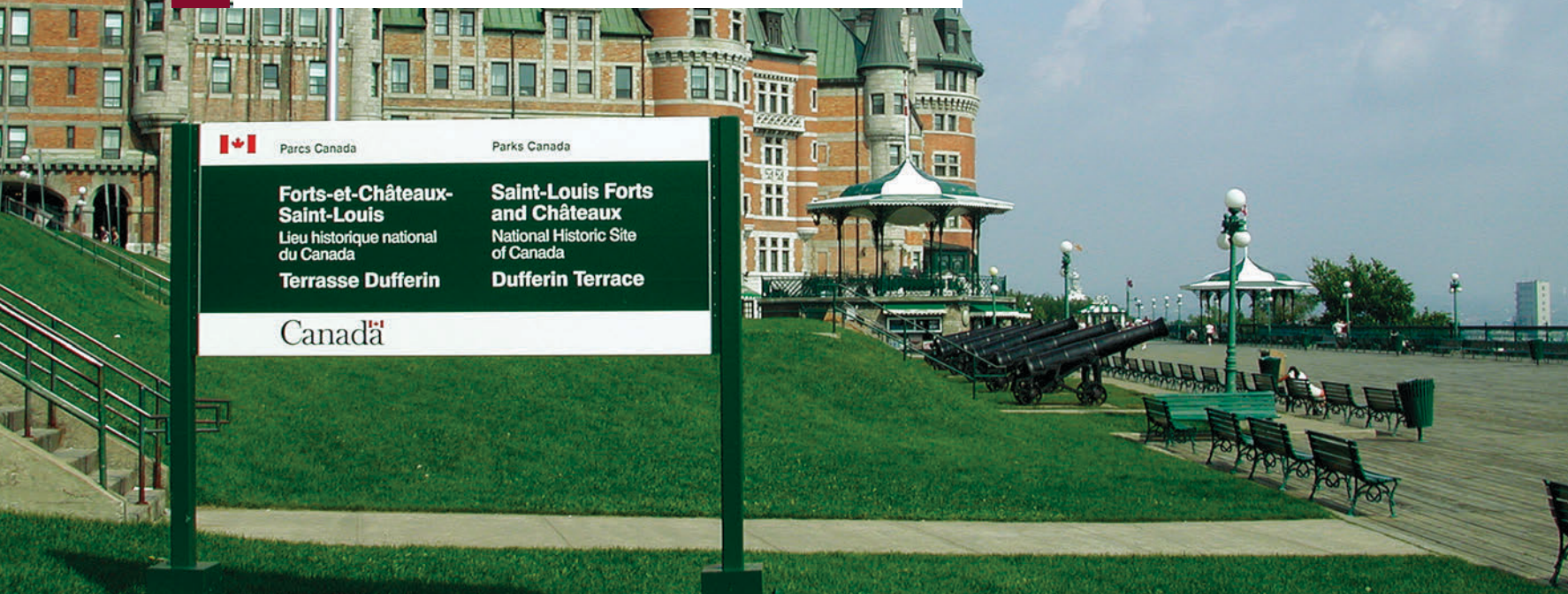
▲ Le Lieu historique national des Forts-et-châteaux-Saint-Louis commémore, depuis 2001, la présence sous la terrasse Dufferin des vestiges archéologiques des forts qui s'y sont succédés.