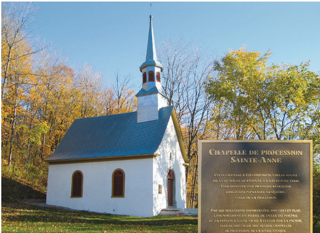
▲ La chapelle de procession Sainte-Anne, située à Neuville dans la région de Portneuf, est reconnue monument historique québécois en 1965 puis lieu historique national du Canada en 2000. Datant du XVIII e siècle, elle a fait l'objet de travaux de restauration à quelques reprises depuis 1967. Elle sert maintenant à la tenue d'activités culturelles et, parfois, à la célébration de mariages civils. © Samantha Rompillon / CIEQ, 2005, Q03-235 et Q03-1105

CHAPELLE DE PROCESSION SAINTE-ANNE CETTE CHAPELLE A ÉTÉ CONSTRUITE VERS LE MILIEU DU XVIII e SIÈCLE ET RÉNOVÉE UN SIÈCLE PLUS TARD. ELLE ILLUSTRE UNE PRATIQUE RELIGIEUSE LONGTEMPS POPULAIRE AU QUÉBEC, CELLE DE LA PROCESSION. PAR SES DIMENSIONS IMPORTANTES, SON CHEVET PLAT, L'ENCADREMENT EN PIERRE DE TAILLE DE PORTAIL ET LA PRÉSENCE D'UNE NICHE À STATUE SUR LA FAÇADE, ELLE SE DISTINGUE DES AUTRES CHAPELLES DE PROCESSION DE LA MÊME ÉPOQUE. LA CHAPELLE DE PROCESSION SAINTE-ANNE A ÉTÉ CLASSÉE MONUMENT ET LIEU HISTORIQUE PAR LA COMMISSION DES MONUMENTS HISTORIQUES DU QUÉBEC LE 6 OCTOBRE 1965. Québec