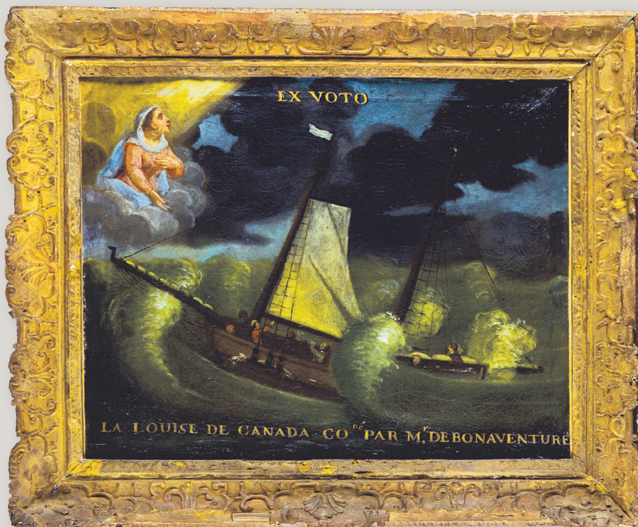
▲ La Rochelle, chapelle des marins de la cathédrale Saint-Louis, ex-voto La Louise du Canada (classé monument historique depuis 1947)