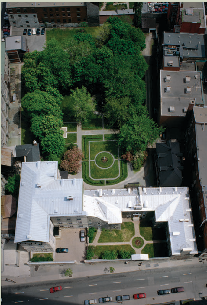
◀ Le jardin du séminaire de Saint-Sulpice, au cœur du Vieux-Montréal, occupe la cour intérieure de l'établissement. Aménagé en 1650, ce qui en fait un des plus vieux jardins conservés au Canada, son intégrité a contribué à la désignation du séminaire à titre de lieu historique national du Canada en 1980.