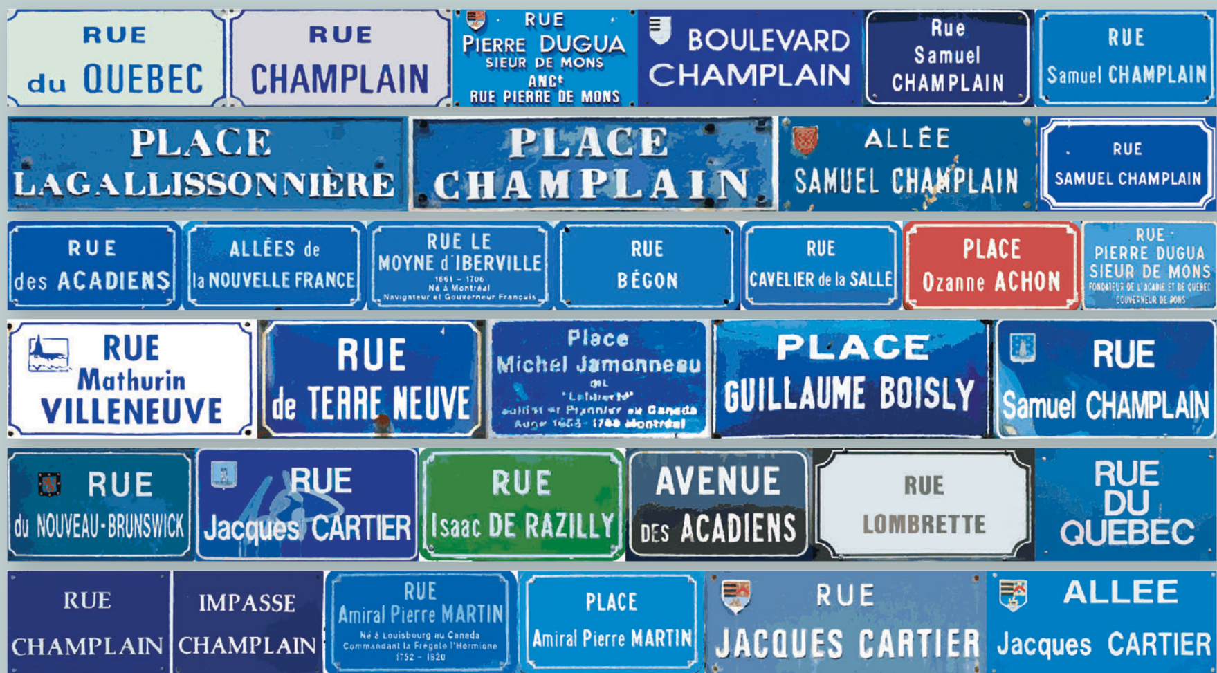
© Service régional de l'inventaire, Poitou-Charentes, 2007

s'étend sur le nouveau faubourg de « Ma Campagne », elle traduit dans plusieurs rues son jumelage pionnier avec Chicoutimi ainsi que l'étroitesse des liens tissés, sur la commune limitrophe de Puymoyen, entre les familles Simard charentaise et québécoise. Enfin, à compter des années 1980, le fait commémoratif s'accroît, cette fois sur l'ensemble de la région, avec un retard marqué par rapport à la façade atlantique. L'on voit alors apparaître, de façon certes mesurée, les noms de simples pionniers, dans les rues des communes dont ils sont originaires (place Michel Jamonneau à Augé, dans les Deux-Sèvres, par exemple), parfois sous l'action d'asso-