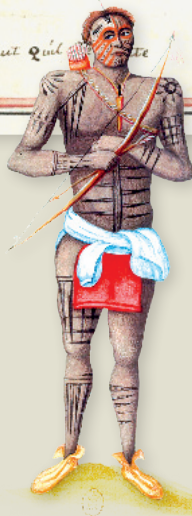
▲ Anonyme, « Guerrier Renard », vers 1730 [détails]

Coulipa, qui « étoit le courier de la nation et le porteur de colliers [de wampum] chés toutes les autres » 2 , fut capturé par des guerriers miamis en 1730. Une campagne militaire franco-indienne, au cours de cette même année, avait entraîné le massacre de centaines de Renards dans la prairie illinoise 3 . Les Miamis, en geste d'alliance et d'amitié, offrirent Coulipa comme esclave au gouverneur Beauharnois. Depuis 1712, les captifs renards (parmi d'autres) alimentaient le marché d'esclaves de la colonie laurentienne, mais Coulipa, considéré comme « un homme dangereux qui a vécu longtemps avec les Iroquois », n'était pas destiné à devenir un simple domestique. Il semble être demeuré prisonnier un an à Québec et les autorités, après avoir envisagé de le vendre à un planteur de Martinique ou de Saint-Domingue, décidèrent finalement de « l'envoye[r] en France pour les galeres » 4 – sort déjà réservé en 1687 à 36 prisonniers iroquois. Déporté à Rochefort – dont l'intendant, depuis 1710, était François de Beauharnois, le propre frère du gouverneur du Canada 5 –, Coulipa ne fut jamais transféré à Marseille, où mouillaient les dernières galères du roi (Zysberg, 1987). Il mourut en effet dans la cité charentaise, comme l'indique une petite notice manuscrite datant des années suivantes et qui