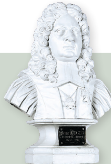
▲ Rochefort, Musée de la Marine, buste de Michel Bégon, intendant de la Marine

Outre le site du conservatoire du bégonia, entièrement dédié à cette